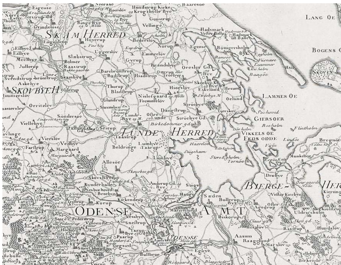
LUNDE HERRED i 1783. Det talte dengang otte sognekirker: Skeby, Norup, Lumby, Lunde, Allesø, Otterup, Østrup og Hjadstrup. Ølund har muligvis udgjort et selvstændigt sogn i middelalderen, ligesom Egense fungerede som sådan indtil 1555. I nyere tid er der opført filialkirker i Hasmark (1892) og Gerskov (1925). Udsnit af Videnskabernes Selskabs kort over Nordfyn, 1:180.000. Tegnet af Caspar Wessel 1780 og stukket af Claude Alexandre Guittair (Guitar) 1783. – Map of Lunde district 1783.