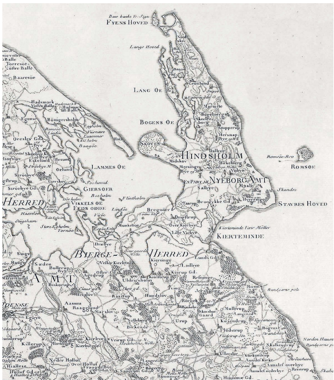
BJERGE HERRED i 1783. Det talte dengang som nu 12 sognekirker: Drigstrup, Munkebo, Kølstrup, Agedrup, Marslev, Birkende, Rynkeby, Revninge, Viby, Mesinge, Dalby og Stubberup. Valgmenighedskirken i Dalby er bygget 1898. Udsnit af Videnskabernes Selskabs kort over Nordfyn. 1:180.000. Tegnet af Caspar Wessel 1780 og stukket af Claude Alexandre Guittair (Guiter) 1783. – Map of Bjerge district 1783.