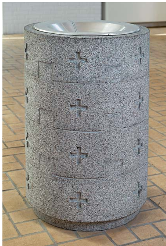
Fig. 5. Døbefont, 1994 (s. 3611). – Font, 1994.

Orglet har 18 stemmer og én transmission, to manualer og pedal, 7 og er bygget 1994 af P. Bruhn & Søn, Årslev. Disposition: Hovedværk: Quintatøn 16', Principal 8', Spidsfløjte 8', Oktav 4', Cornet I-III, Mixtur IV, Trompet 8'. Overværk: Rørgedakt 8', Salicional 8', Copula 4', Oktav 2', Quint 1 \frac{1}{3} ', Vox humana 8'; svelle. Pedal: Untersatz 16', Oktav 8', Quintatøn 4', Oktav 2', Fagot 16', Basun 8' (transmission). Tremulant for hele orglet. Kopler: OV-HV, HV-P, OV-P. Temperering: Vallotti. Mekanisk aktion, sløjfevindlader. Orglet, der er opbygget af tre enheder (hovedværk, overværk og pedalværk), er tegnet af kirkens arkitekter og har prospektpiber af tinlegering og træ. Overværkets facade udgøres af svelledøre. Orgelhussene fremstår i hvidpigmenteret birk. Opstillet i det nordøstre hjørne.