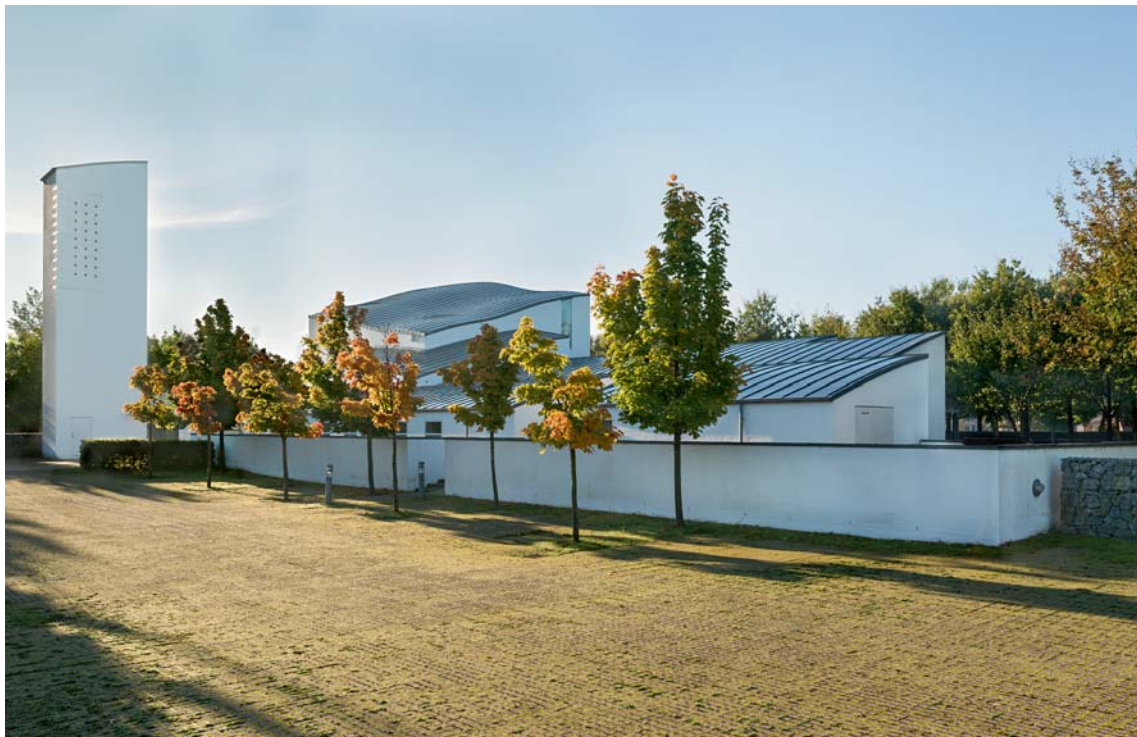
Fig. 1. Kirken set fra nordvest. Foto Arnold Mikkelsen 2015. – Church seen from the north west.