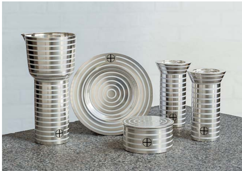
Fig. 4. Altersølvet, 1999, tegnet af Fogh & Følner og udført af guldsmed Per Sax Møller, Kbh. (s. 3610-11). – Altar plate, 1999, designed by Fogh & Følner and made by goldsmith Per Sax Møller, Copenhagen.

sine kirkebyggerier. Foghs og Følners kirke har eksempelvis tydelige referencer til Værløse Kirke (1971), der står med højtrestede halvgavle og et monumentalt, slankt tårn. Fogh og Følner har imidlertid udviklet udtrykket videre, med Egdal Kirke (1990) som stilistisk bindeled mellem Holger Jensens idéer og Foghs og Følners selvstændige kirkebyggeri. I Tornbjerg er alle skarpe konturer således opblødt med kurver. I materialevalg og farveholdning ses ligeledes et skred væk fra den tidligere populære blanke teglsten mod et udtryk, der står i dialog med opfattelsen af den traditionelle, hvidkalkede landsbykirke fra middelalderen.