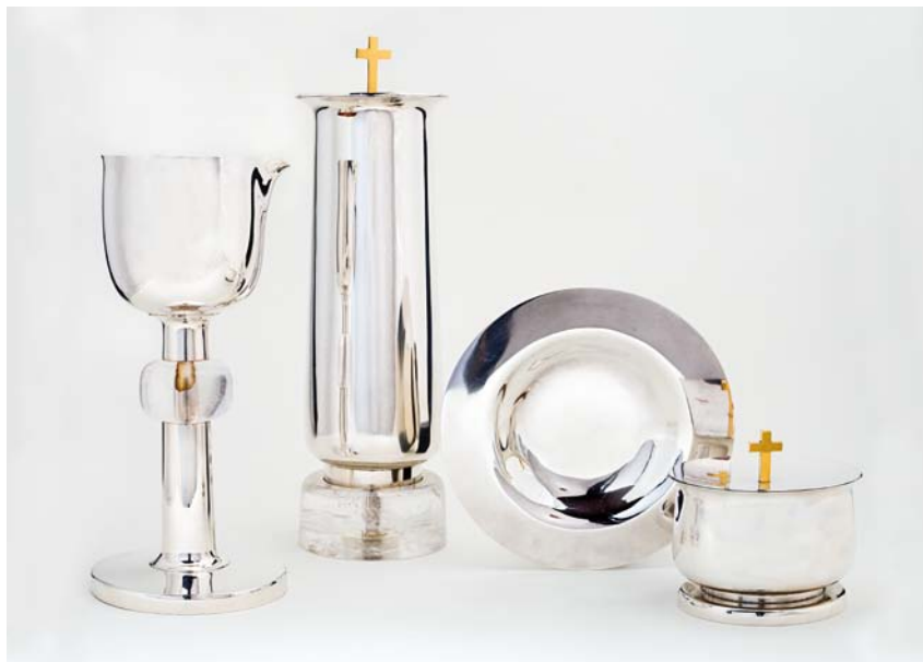
Fig. 4. Altersølv. Fra venstre ses kalk nr. 2 fra 2007, alterkanden, disk og oblatæske fra 1986, alt udført af Hjørdis og Iben Hougård, Kolding (s. 3006). – Altar plate. From the left: chalice no. 2 from 2007, altar jug, paten and wafer box from 1986, all made by Hjørdis and Iben Hougård, Kolding.

kirkeens 'altertavle' (jf. fig. 3). Haven er indrettet med et vandspejl i nordre side, umiddelbart bag døbefonten, som symboliserer Jordanfloden. Et cedertræ (atlasceder) henviser til Salomons tempel (jf. 1. Kong. 7,2-11), bag alterbordet er plantet kærlighedstræ, figen (Syndefaldet) og vin (Nadveren), mens der mod syd ved ligkapellet ses en vedbend, hvis gulnede, tilsyneladende visnende blade skal henviser til Opstandelsen (jf. Joh. 11,25). Holger Jensen har udviklet ideen med at lade en atriumgård danne baggrund for alteret i Vestervang Kirke, Helsingør (1966-82, Frederiksborg Amt). 5