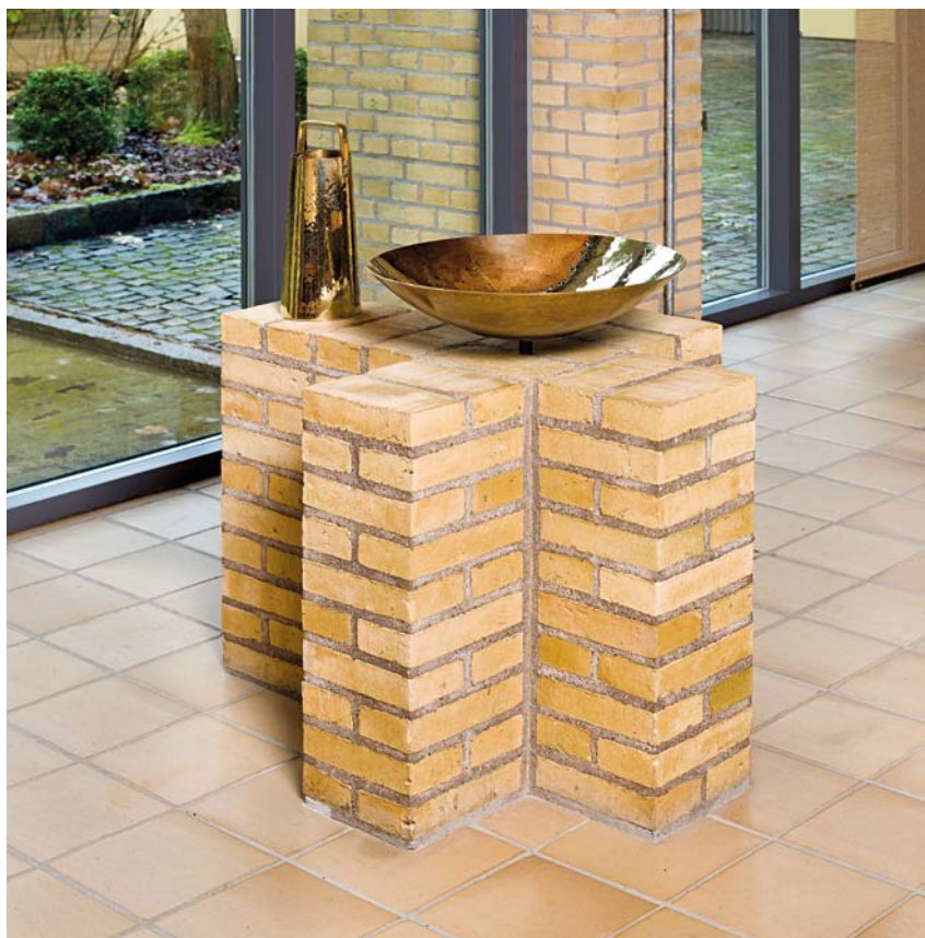
Fig. 5. Døbefont, 1986, tegnet af Holger Jensen, dåbsfad, 1986, skænket af konfirmanderne fra Højmarkskolen og dåbskande, udført 1986 af Hjørdis og Iben Hougård, Kolding (s. 3007). Foto Arnold Mikkelsen 2013. – Font, 1986, designed by Holger Jensen, baptismal dish 1986, donated by Confirmation candidates from Højmark School, and baptismal jug, made in 1986 by Hjørdis and Iben Hougård, Kolding.

Orglet er bygget 1986 af P. Bruhn & Søn, Årsløv, og har 20 stemmer, to manualer og pedal. Disposition: Hovedværk: Principal 8', Rørføj-