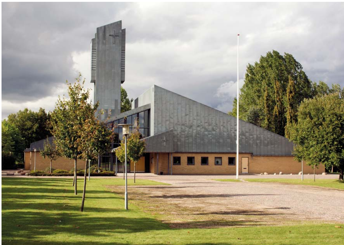
Fig. 1. Kirken set fra syd. 2013. – The church seen from the south.