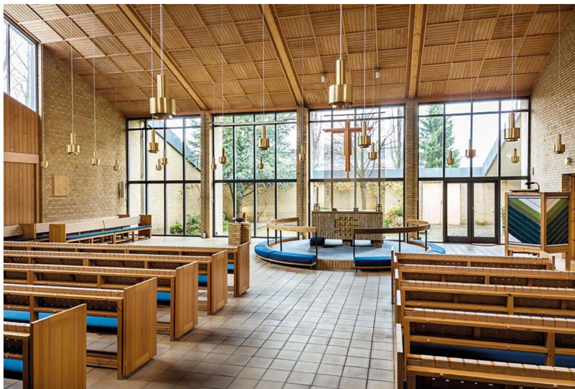
Fig. 3. Interiør set mod nordøst. 2013. – Interior looking north east.

rum, der indlemmer naturoplevelse og årstidernes skiften i atriumgårdens have, som kirkesalen vender ud mod.