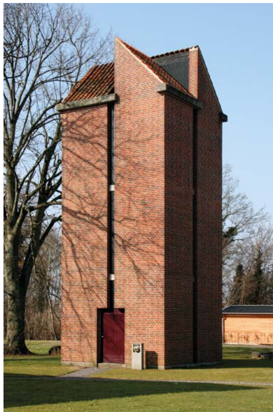
Fig. 3. Det fritstående tårn. – The free-standing bell tower.

Det fritstående klokketårn i to stokværk, rejst hvor den middelalderlige \dagger kirkelade lå (jf. s. 2911), er som selve kirken opført i røde tegl over en betonsokkel. Tårnet har til dels samme tagløsning som kirkesalen, idet hver af de fire facader er afsluttet med en 'halvgavl'. Facaderne har hver en lodret lyssprække i midten. Åbninger er uden glas, men delvist dækket af indsatte, mørkbejsede brædder, der er fæstnet til tværgående betonbånd. En retkantet dør i østfacaden åbner ind i tårnet, hvorfra