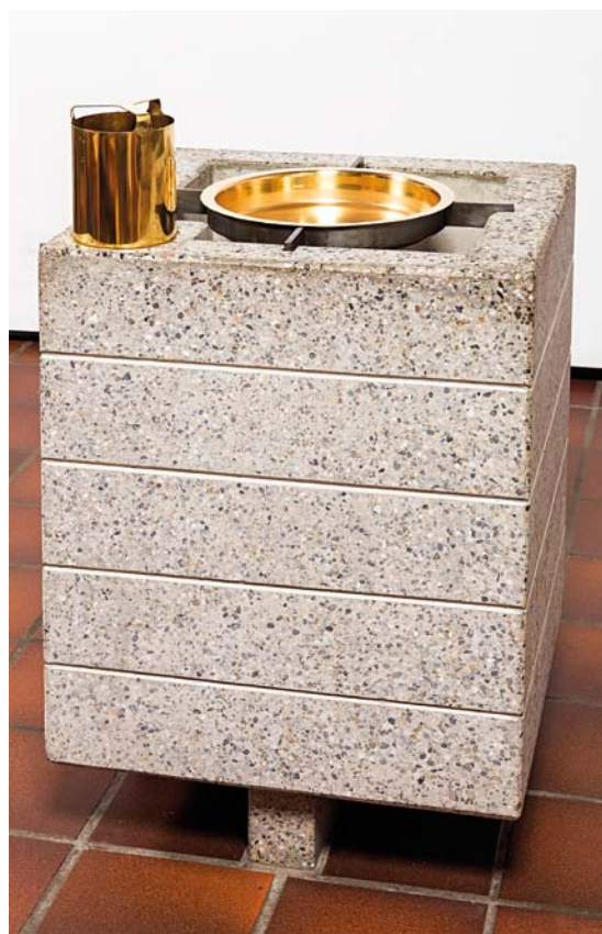
Fig. 5. Døbefont, dåbsfad og -kande, tegnet af Ebbe Lehn Petersen 1982 (s. 2909). Foto Arnold Mikkelsen 2013. – Font, baptismal dish and jug, designed by Ebbe Lehn Petersen, 1982.

Papirklip , 2012, med titlen »Helligånden«, 52×40 cm, af David Gottschalck Bolving. Ophængt ved indgangsdøren i kirkens sydvestlige hjørne.