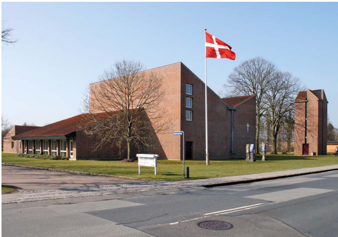
Fig. 1. Kirken set fra sydvest. – The church seen from the south west.