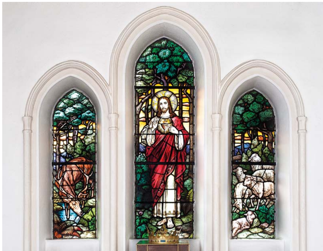
Fig. 4. Glasmaleri forestillende Jesu Hellige Hjerter stående i et landskab, udført o. 1930 af Franz Mayer & Co., München (s. 2899). Foto Arnold Mikkelsen 2013. – Stained glass showing the Sacred Heart of Jesus standing in a landscape, executed c. 1930 by Franz Mayer & Co., Munich.

Kirken, der er tegltækket, står med blank mur udvendigt og er hvidkalket i det indre. I koret ligger aflange, grå klinker i forskudte bånd, mens små, grå og sorte klinker i skibet er lagt i et skaktavlsmønster.