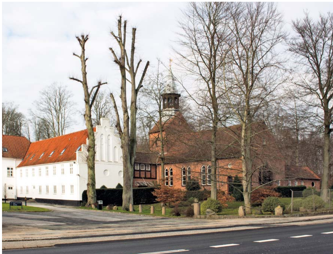
Fig. 1. Kirken set fra sydøst. Foto David Burmeister Kaaring 2014. – The church seen from the south east.