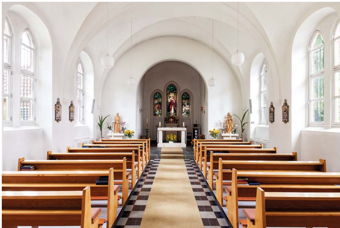
Fig. 2. Interiør set mod øst. Foto Arnold Mikkelsen 2013. – Interior looking east.