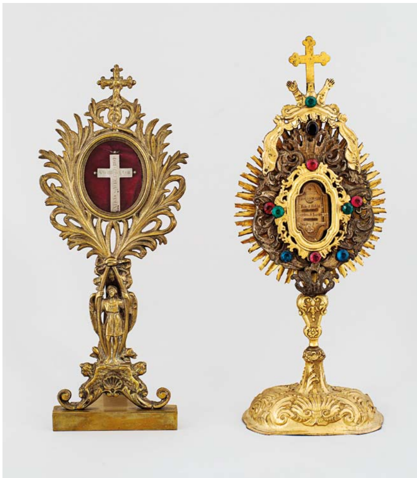
Fig. 6. Relikvarium nr. 2, skænket 1967 af pastor Hansen, Svendborg, 1967, og relikvarium nr. 1 fra tiden o. 1900 (s. 2901). – Reliquary no. 2, donated in 1967 by Pastor Hansen, Svendborg, 1967, and reliquary no. 1 from c. 1900.

ret et Jesumonogram indbefattende et kors. Under bunden er stemplet »J. Schlossarek, Breslau 1892«.