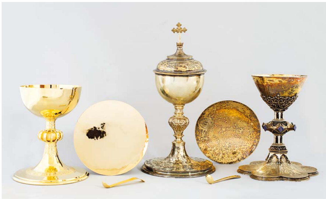
Fig. 5. Altersæt nr. 2 fra nyeste tid samt et ciborium udført af sølvvarefabrikken J. Schlossarek, Wrocław, og altersæt nr. 1 fra tiden o. 1899 (s. 2900). – Altar set no. 2 from the most recent times, and a ciborium made at the silverware factory J. Schlossarek, Wrocław, and altar set no. 1 from c. 1899.

To sidealterborde (jf. fig. 2), o. 1930, af travertin, 80×40 cm, 106 cm høje, og udformet som alterbord nr. 1 er opstillet foran triumfvæggen. På bordene er placeret to formentlig samtidige sidealterfigurer af lindetræ, forestillende Maria med barnet (syd) og Skt. Josef med vinkel og sav (nord). De er hhv. 100 og 102 cm høje.