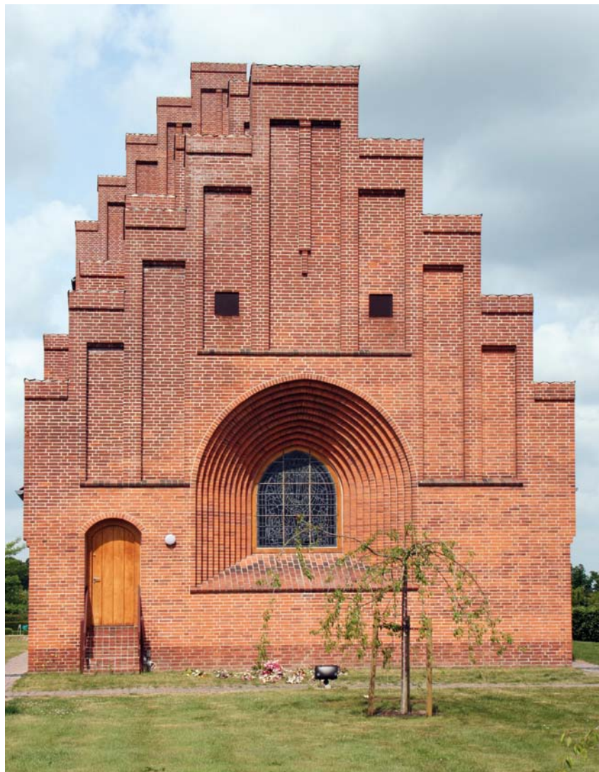
Fig. 2. Korgavl. – Chancel gable.

Raahauge-Askegaard, Odense, der inkluderede etablering af urnebegravelser nordvest for kirken samt en udvidelse af kistebegravelserne syd for kirken. I samme plan var reserveret plads til anlæggelse af en åben plæne til urnebegravelser sydligst på kirkegården, der blev realiseret i 1983. 2001 udvidedes kirkegården mod sydvest med en halvcirkulær plæne efter tegninger af landskabsarkitekt Marcel Crutelle, Odense. 2