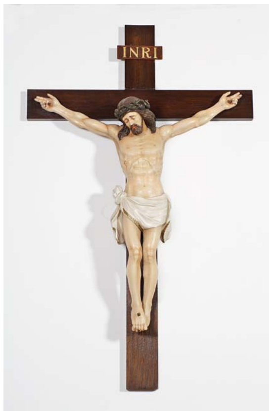
Fig. 6. Krucifiks, 1947, udført af Thorvald Petersen, Odense (s. 2730). – Krucifiks , 1947, by Thorvald Petersen, Odense.

Krucifiks (fig. 6), 1947, af cedertræ, udført af Thorvald Petersen, Odense, og skænket af konsul Th. Andersen, Odense. 13 Jesus hænger i skrånende arme med velsignende hænder. Hovedet, med flettet tornekroner og skulderlangt hår, og de overlagte fødder er fæstnet med samme nagle. Han er ikklædt et lændeklæde med karakteristisk snip ved højre hofte, der antyder en vis inspiration fra Claus Bergs krucifikstype. 14 Korset er glat med en plade foroven, hvorpå står »INRI« med forgyldte versaler. Krucifikset er udført i en enkel bemaling med kors og hår i mørkebrunt, lænde-klæde i råhvid med forgyldt bort og detaljeret