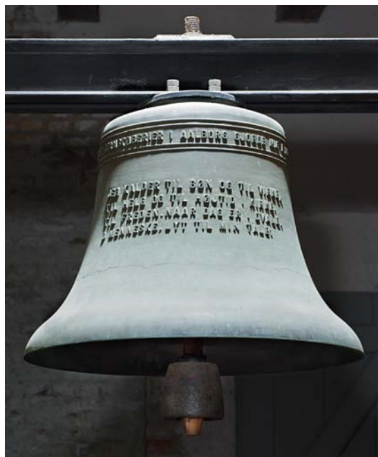
Fig. 7. Klokke, støbt af De Smithske Jernstøberier i Aalborg 1942 (s. 2731). – Bell, founded by De Smithske Jernstøberier in Aalborg, 1942.

Klokker . 1) (Fig. 7), 1942, støbt af De Smithske Jernstøberier, Aalborg. Tværmål 68 cm. Om halsen læses med reliefversaler: »De Smithske Jernstøberier i Aalborg gjorde mig i aaret 1942«, og med tilsvarende skrift på klokkelegemet: »Jeg kalder til bøn og til virke/ Til helg og til højtid i kirke/ Til freden, naar dag er i dvale/ O menneske lyt til min tale«. Ophængt i en slyngbom i tårnets klokkestokværk. 2) 1989, støbt af Petit & Fritsen, Holland, tværmål 120 cm. Om halsen en indskrift med reliefversaler mellem to lister: »Til Guds ære og Næsby Menigheds tjeneste støbtes denne klokke 1989 af Petit & Fritsen i