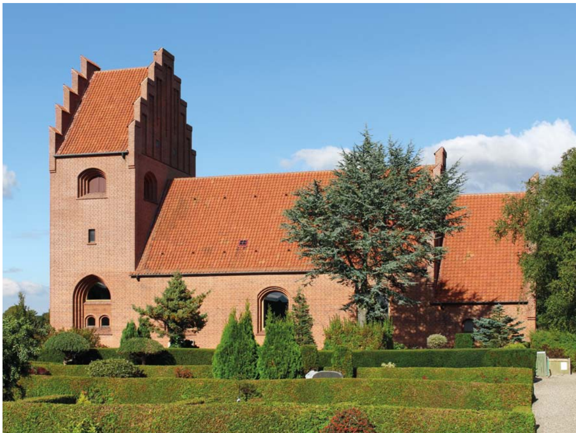
Fig. 1. Ydre set fra syd. Foto Martin Wangsgaard Jürgensen 2012. – Exterior seen from the south.