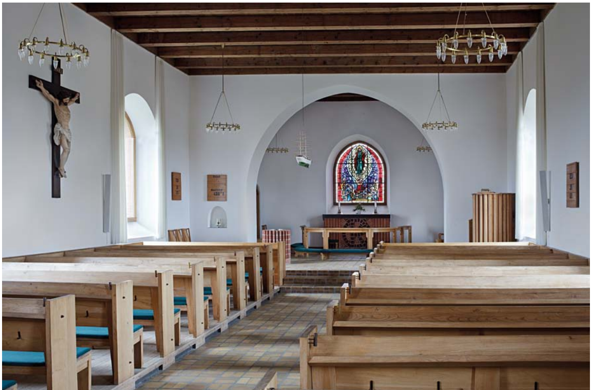
Fig. 4. Indre, set mod øst. Foto Arnold Mikkelsen 2012. – Interior seen towards the east.

Altersæt . 1) Kirkens første altersæt blev anskaffet på forskellig vis frem mod indvielsen 1942.