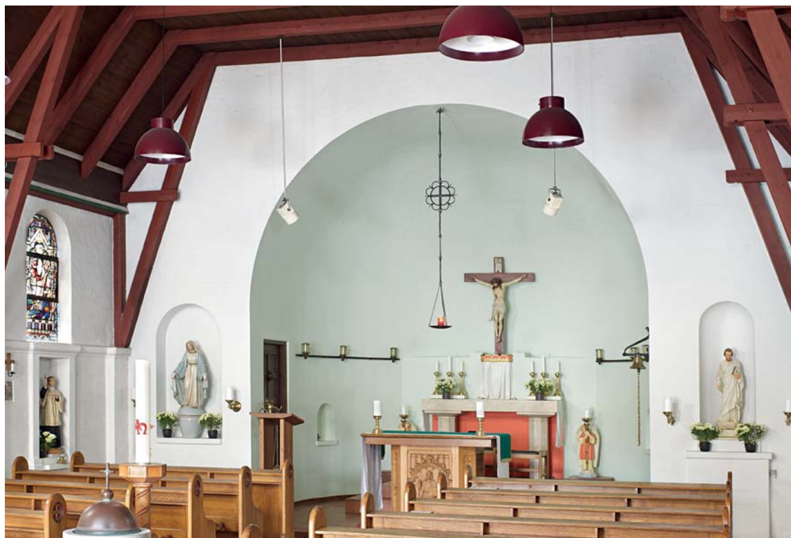
Fig. 3. Kirken set mod koret. Foto Arnold Mikkelsen 2011. – Interior looking west.

Lignende glugger genfindes i tårnet , hvor de oplyser trappen til klokkestokværket, der til hver side har to koblede glamhuller med samme udformning som gavlvinduerne.