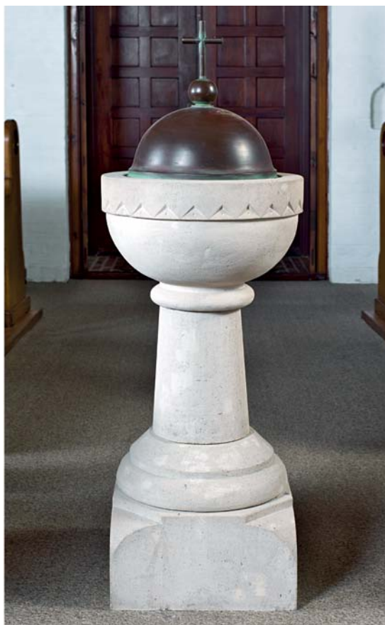
Fig. 7. Døbefont, o. 1927 (s. 2622). Foto Arnold Mikelsen 2011. – Font , c. 1927.

†Korskranke , o. 1927. Gitteret, der nu kun anes i form af spor i gulvet, blev fjernet o. 1970.