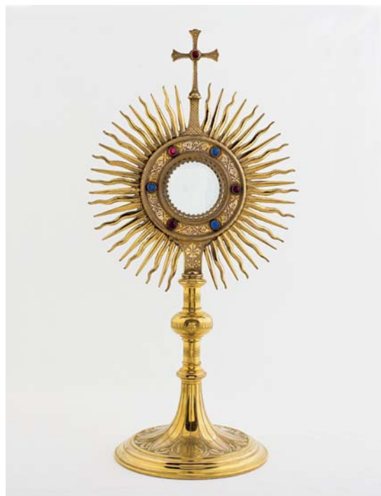
Fig. 6. Monstrans, 1900-tallet (s. 2622). – Monstrance, 1900s.