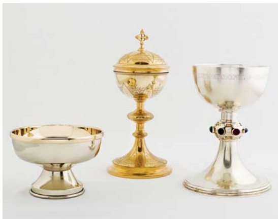
Fig. 5. Altersølv. Hostieskål, ciborium og kalk (s. 2622-23). Foto Arnold Mikkelsen 2011. – Altar plate. Host cup, ciborium and chalice.

placeret i triumfmurens nordlige niche, men blev 2005 flyttet til \dagger dåbskapellet i kirkens sydøstlige hjørne, der herefter indrettedes som Mariakapel. 3