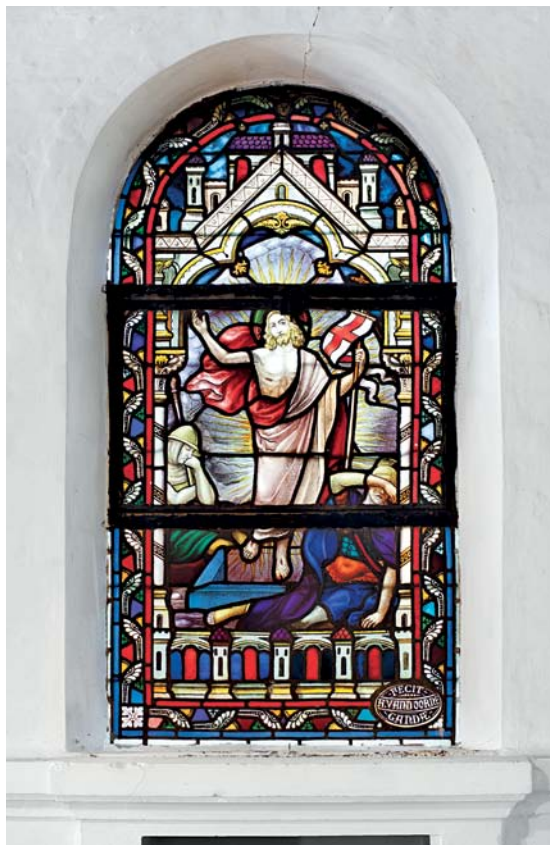
Fig. 4. Glasmaleri, 1926-27, udført af A. van Doorne, Gent (s. 2620). Foto Arnold Mikkelsen 2011. – Stained glass, 1926-27, by A. van Doorne, Ghent

hældning og er trukket frem over kældernedgangen.