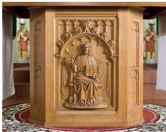
Fig. 8. (†) Prædikestol, genanvendt som sokkel for alterbord nr. 2 (s. 2623). Foto Arnold Mikkelsen 2011. – (†) Pulpit, re-used as base for communion table no. 2.

Sakristikrucifiks , nyere, af messing, 55,5 cm højt. Kristus hænger i udstrakte arme med hovedet en smule på skrå og fødderne lagt over hinanden. Korset er glat, har trepasender, en profileret kant, og nær korsskæringen et forenklet krabbeblad; tværs over den øverste korsende en skriftrulle med bogstaverne »INRI«. Korset er monteret på en stage med svungen fod med høj standkant,