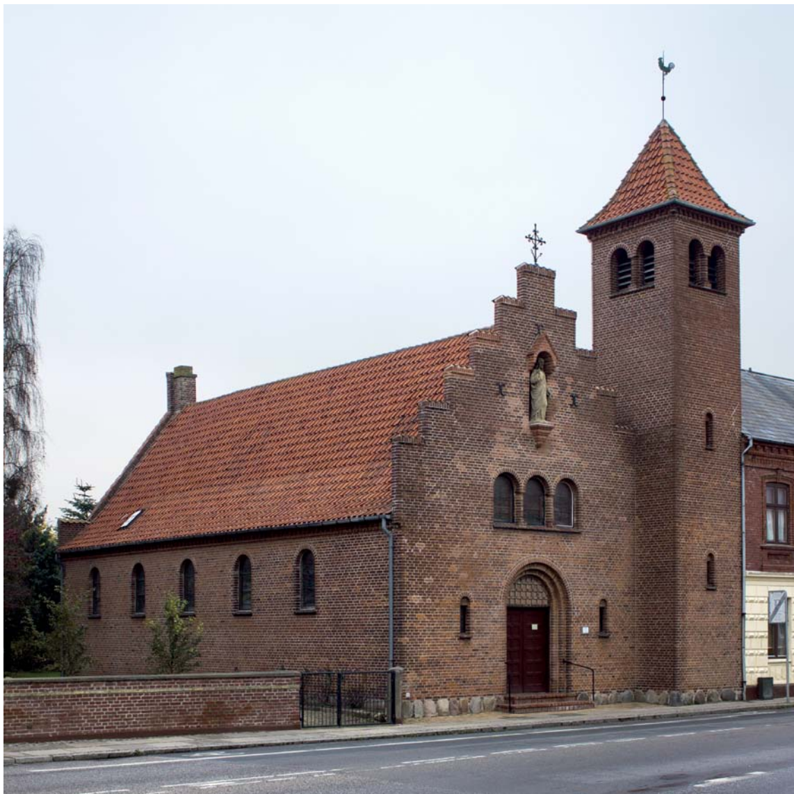
Fig. 1. Kirken set fra sydøst.— The church seen from the south east.