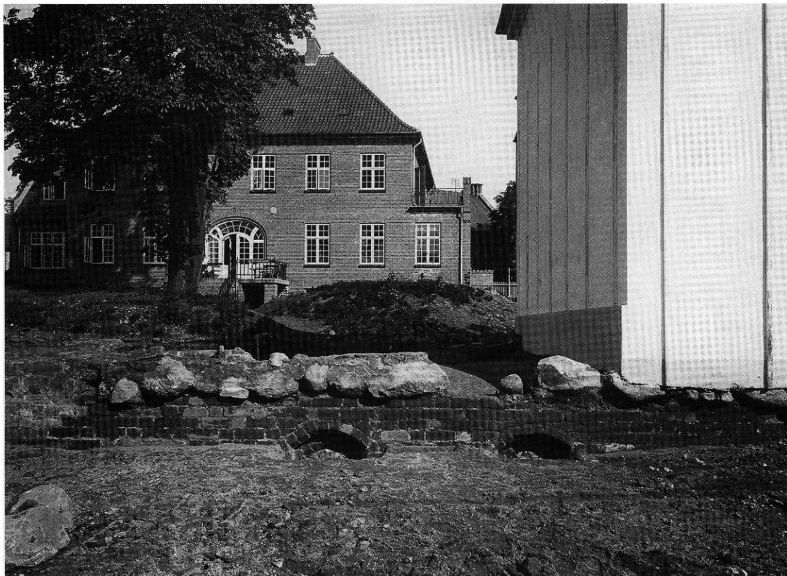
Fig. 3. Vestre del af overhvælvet kælder, set fra syd. Th. ses gavlen på den bevarede rest af den ældre bispegård. C. M. Smidt fot. 1916. - Western bays of vaulted basement, seen from the south. To the right is seen the former Bishop's Residence. In the background is the present Residence.

rede S. Knuds Kirkestærde-Mageløs. En forbindelsesvej fra den daværende Dronningegård til Gråbrødre kloster, omtalt inden for tidsrummet 1504-11, kan være identisk med den senere Klaregade, der på Brauns og Hogenbergs Odenseprospekt 1593 (fig. 1) dog er markeret som et bredt gadeforløb mellem Vestergade og åen. 18