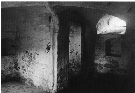
Fig. 4. Vestre kælderrum, set mod nordvest. I hjørnet er sekundær hypocaust. C. M. Smidt fot. 1916. - Western bay of the basement, seen towards the north-west. In the corner is a secondary hypocaust.

Af de på 1593-prospektet synlige bygninger (fig. 1) kan kun det grundmurede hus, der lå med østgavlen ud mod Klaregade regnes for klosterets hovedbygning. Huset var tydeligvis opført i to dele, hvoraf den vestre må være identisk med en bygning, indeholdende den endnu bevarede kælder, mens den østre, formentlig senere tilføjede del, 21 muligvis kan være en lille, klosteret tilhørende kirke(?) . 22