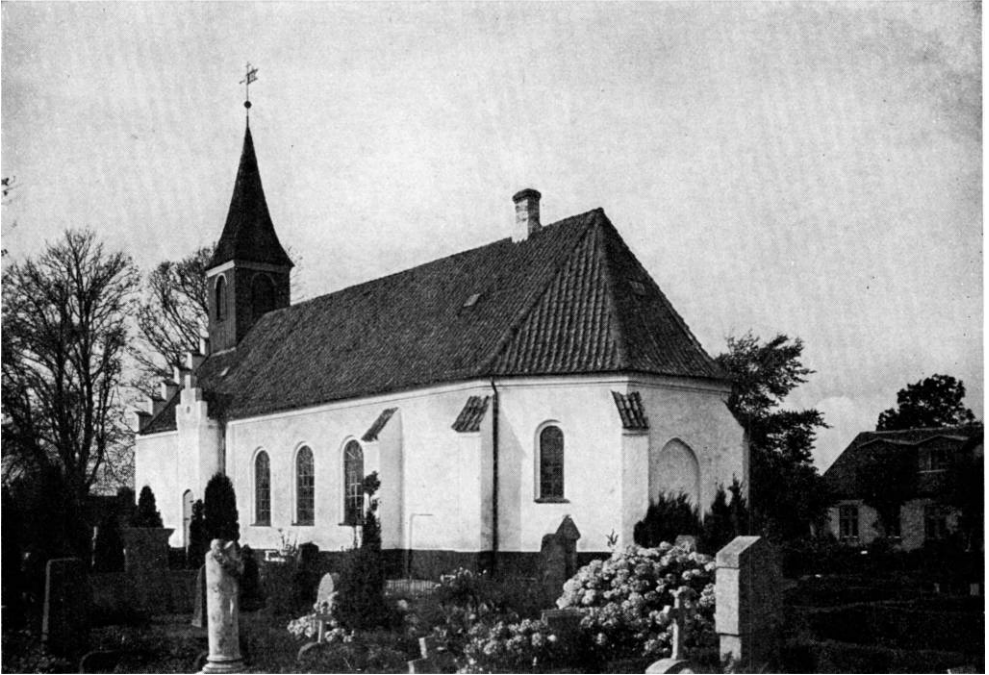
Fig. 1. Gedesby. Ydre, set fra sydøst.