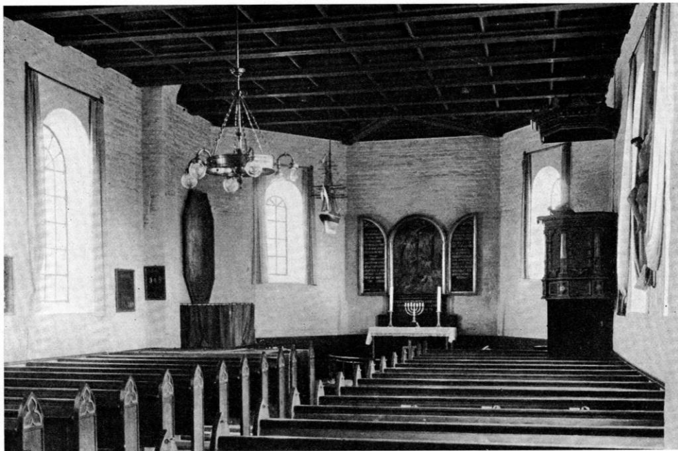
Fig. 3. Gedesby. Indre, set mod øst.