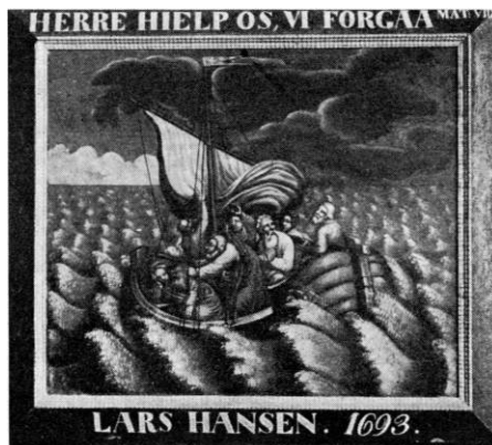
E. Skov 1952

Klokker . 1) Støbt af Konrad Kleimann i Lybæk 1703. Indskrift: »Vigilate