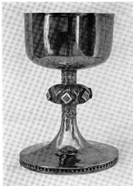
E. Skov 1952

Altersølv. Kalk (fig. 5), sammensat af dele fra forskellig tid, nu 17 cm høj. Ældst er fod og knop, fra o. 1500. Foden er rund med lav standkant, som gennembrydes af firpasformede huller. På oversiden er fæstnet et lille krucifiks med minuskelskriftbånd (»inri«). Stor knop med seks rudebosser, hvoraf de fem har reliefminuskler »iecus«, den sjette en graveret roset; mellem bosserne er der på over- og undersiden lancetformede tunger med graverede fiskeblærer. De cylindriske skaftled har mellem spinkle perlestave et opdrevent