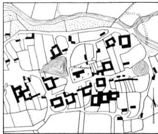
Fig. 9. Gedesby 1807.

1 Frederik I.s danske Registranter, s. 92. 2 Optegnelser i Dansk Folkemindesamling. 3 Dokumenter og breve for hele stiftet. 4 Dokumenter vedrørende Dronning Sophies Livgeding 1570—1630 (RA). 5 Kommissionsakter ang. Lolland-falsterske Kirker 1741 (RA). 6 Høyen: Notesbog XIII, 7. 7 Inv. nr. MDCCXCVIII. 8 Henningsen: Kirkeskibe, s. 76. 9 Danske malede Portrætter IX, 245; AarbLollFalst. 1937, s. 62 f. 10 Danske malede Portrætter IX, 246; AarbLollFalst. 1937, s. 64. 11 Hofman: Foundationer VI, 2, 156; Rhode II, 113. 12 Abildgaard: Notesbog I, 120. 13 Larsen: Laaland Falster III, 40.