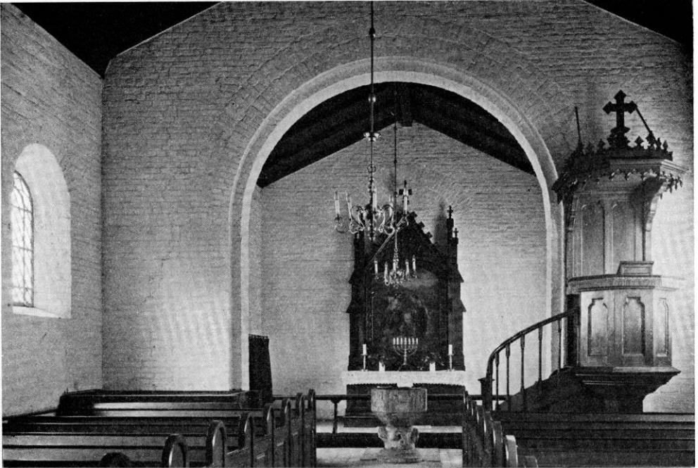
Fig. 3. Skelby. Indre, set mod øst.