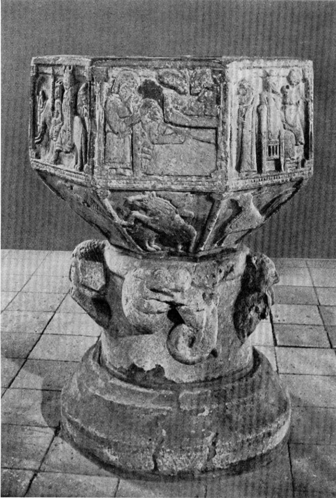
Fig. 5. Skelby. Døbefont (s. 1364).