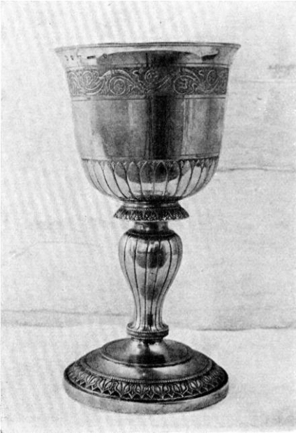
E. Skov 1952