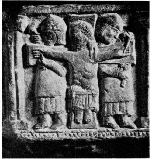
Fig. 6—7. Skelby. Detailler af døbefonten (s. 1364).