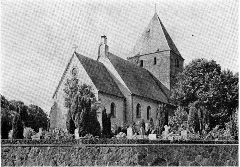
Fig. 1. Skelby. Ydre, set fra nordøst.