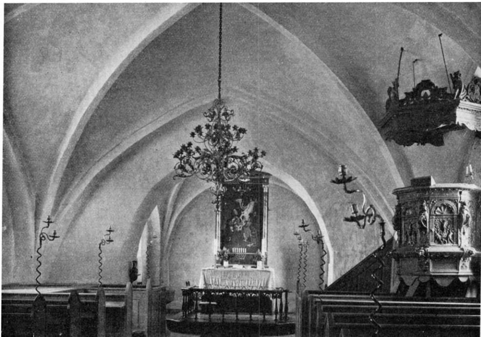
Fig. 3. Stadager. Indre, set mod øst.