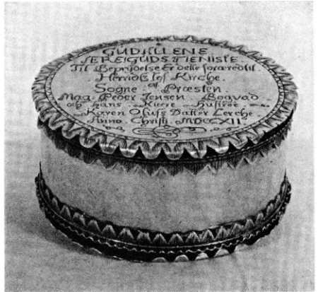
E. Skov 1951

† Klokker . 1528 havde kirken tre klokker, hvoraf de to mindste, der vejede henholdsvis tre skippund, to lispund (496 kg) og fem lispund (40 kg), afle-