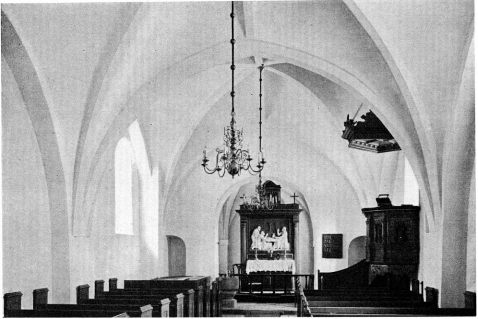
Fig. 3. Herreslev. Indre, set mod øst.