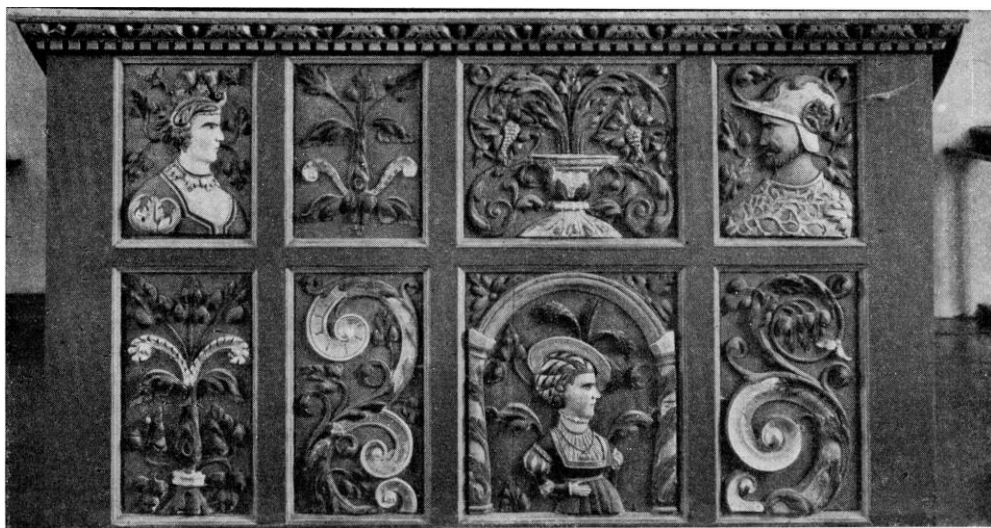
Fig. 4. Vejleby. Alterbordsforside (s. 830).