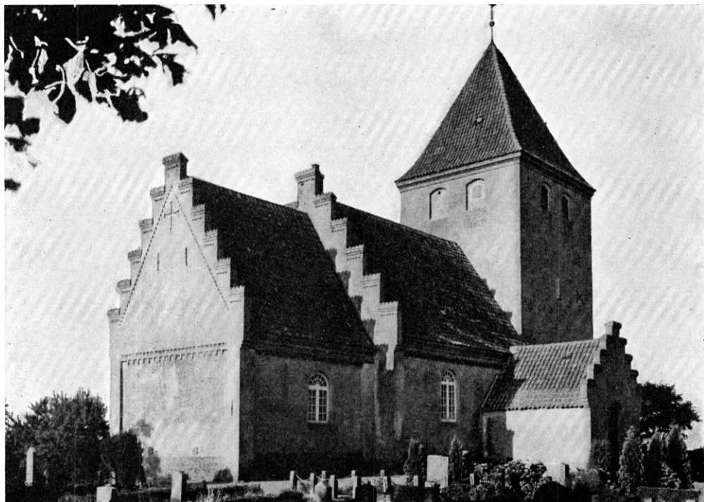
Fig. 1. Vejleby. Ydre, set fra nordøst.