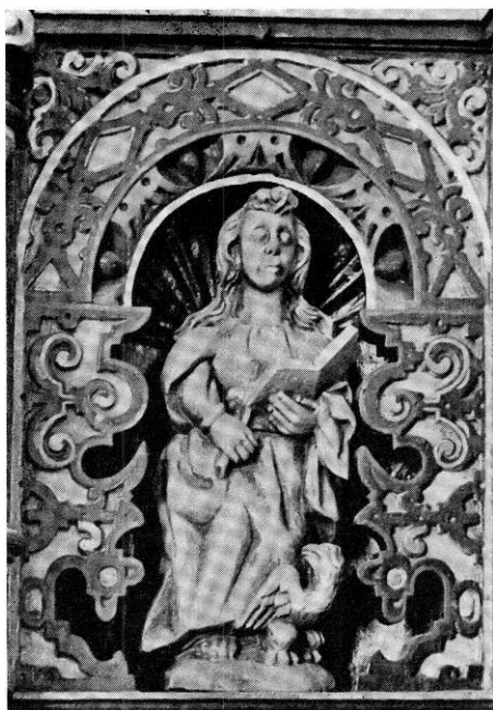
E. Skov 1950