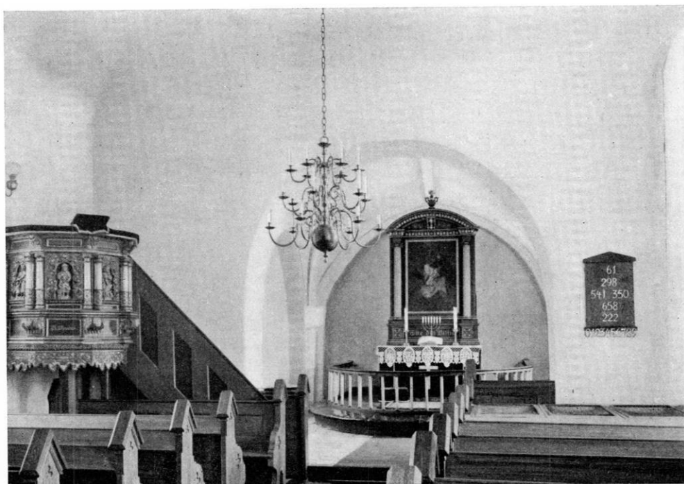
Fig. 3. vejleby. Indre, set mod øst.