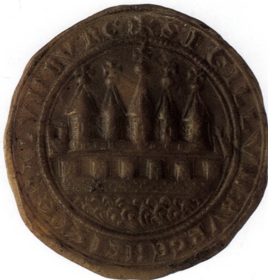
Fig. 3. Kalundborgs bysegl o. 1400. Rigsarkivet fot. - The seal of Kalundborg c. 1400.