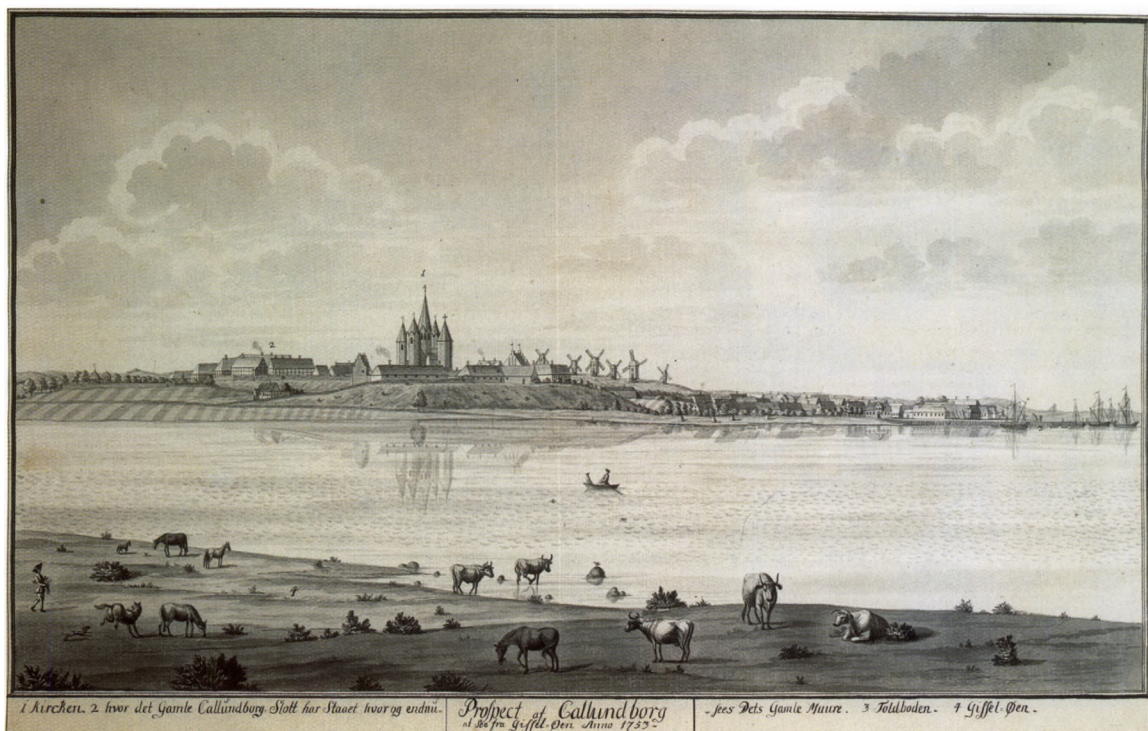
Fig. 1. Prospekt af Kalundborg, set fra Gisseløre. Lavering i Frederik V.s atlas ved Johan Jacob Bruun 1753. Kgl. Bibl. - Prospect of Kalundborg, seen from Gisseløre.