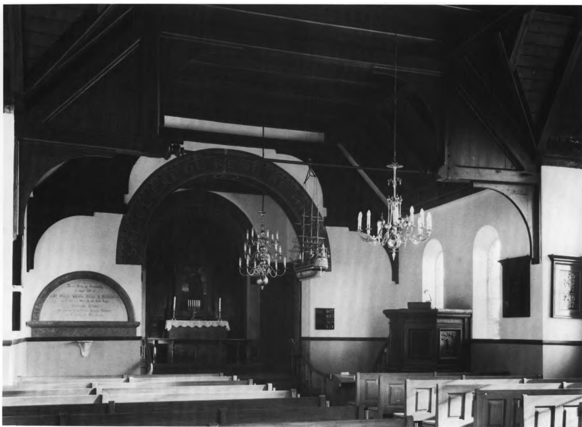
Fig. 4. Indre, set mod øst. - Interior to the east.