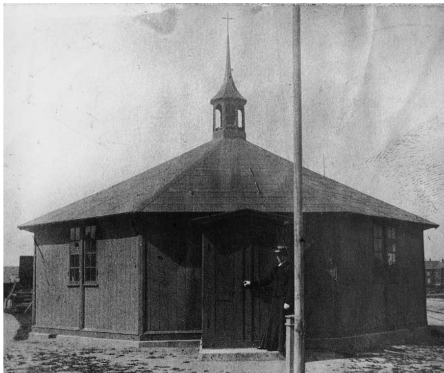
Fig. 3. Byens \dagger metodistkirke 1907-23, en centralbygning af træ, der fungerede som vandrekirke. – The Methodist church 1907-23, a migratory building.