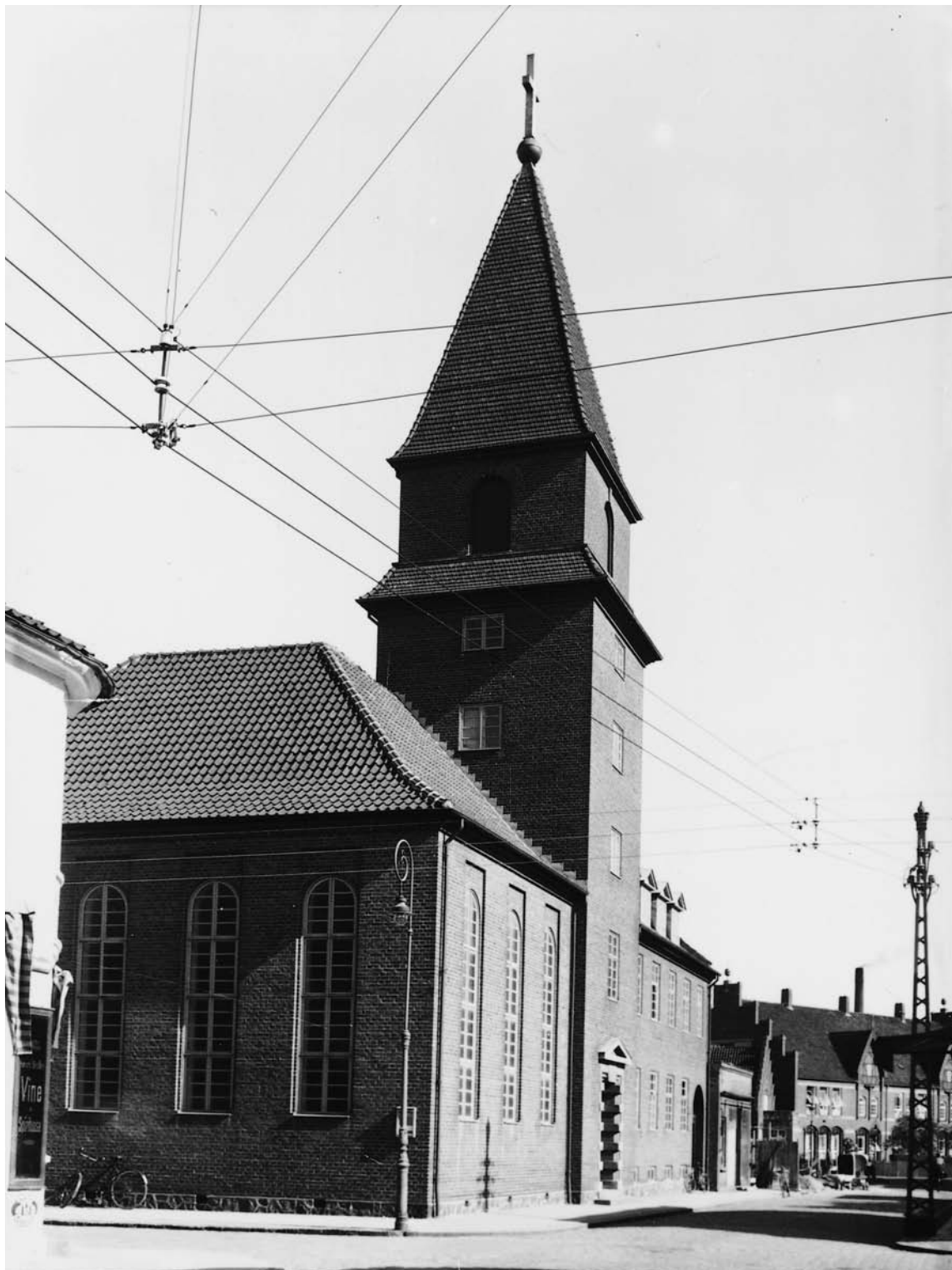
Fig. 1. Kirken set fra nordvest hen over Tvergade. – The church seen from the north west.