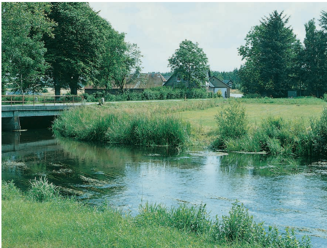
Fig. 1. Gudenåen ved Brestenbro set mod sydøst. Det nedbrudte kapel har ligget bag træerne til højre. – The Gudenå river at Brestenbro, looking south east. The ruined chapel was behind the trees on the right.