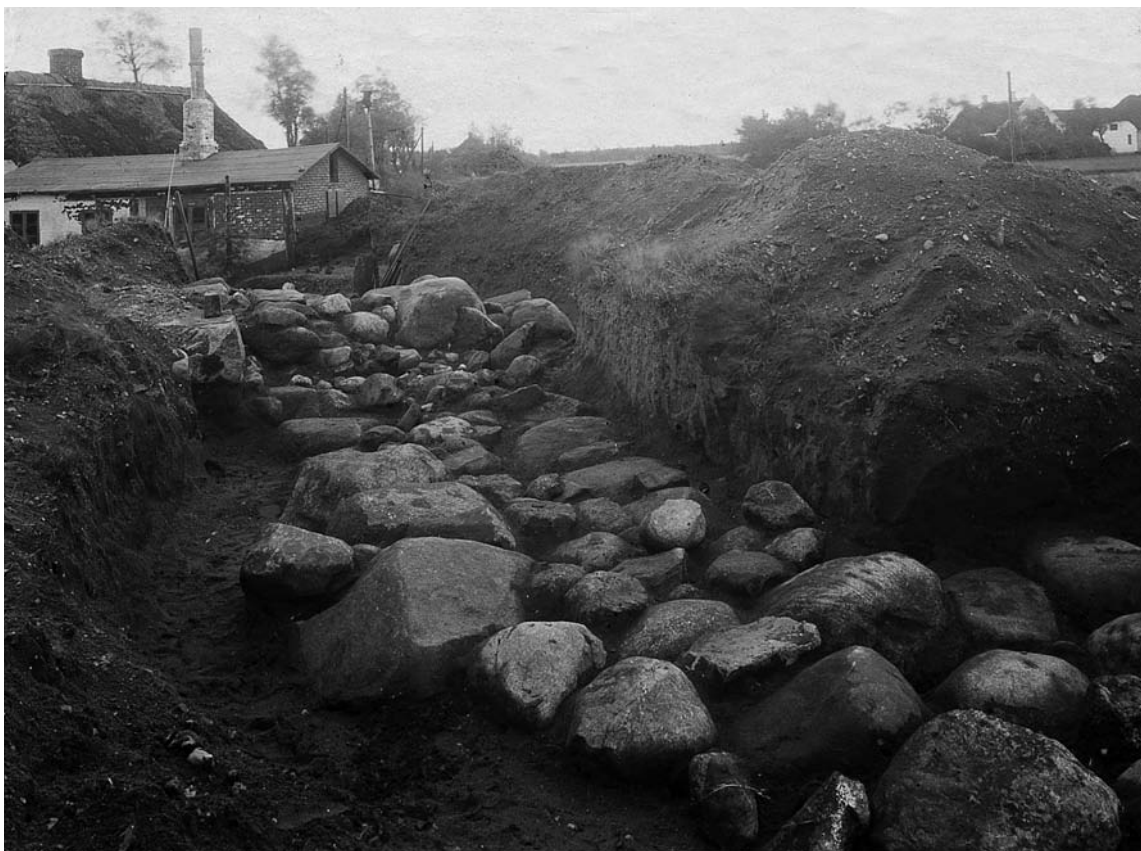
Fig. 2. Fundamentet af kapellets formodede sydmur set fra vest. – The foundation of what was presumably the south wall of the chapel, seen from the west.

og o. 1500 tales om et jordstykke syd for Vor Frue kapels gård i Brestenbro, 5 måske den ovennævnte præstegård.