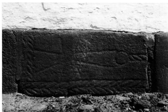
Fig. 3. Fragment af romansk ^gravsten, nu på Tyrrestrup (s. 5039). Hans Henrik Engqvist fot. 1955. - Fragment of Romanesque *tombstone, now at Tyrrestrup manor.

Muligvis en alterbordssten med relikviegemme? Indmuret i hovedfløjens indgangsrisalit, syd for døren.