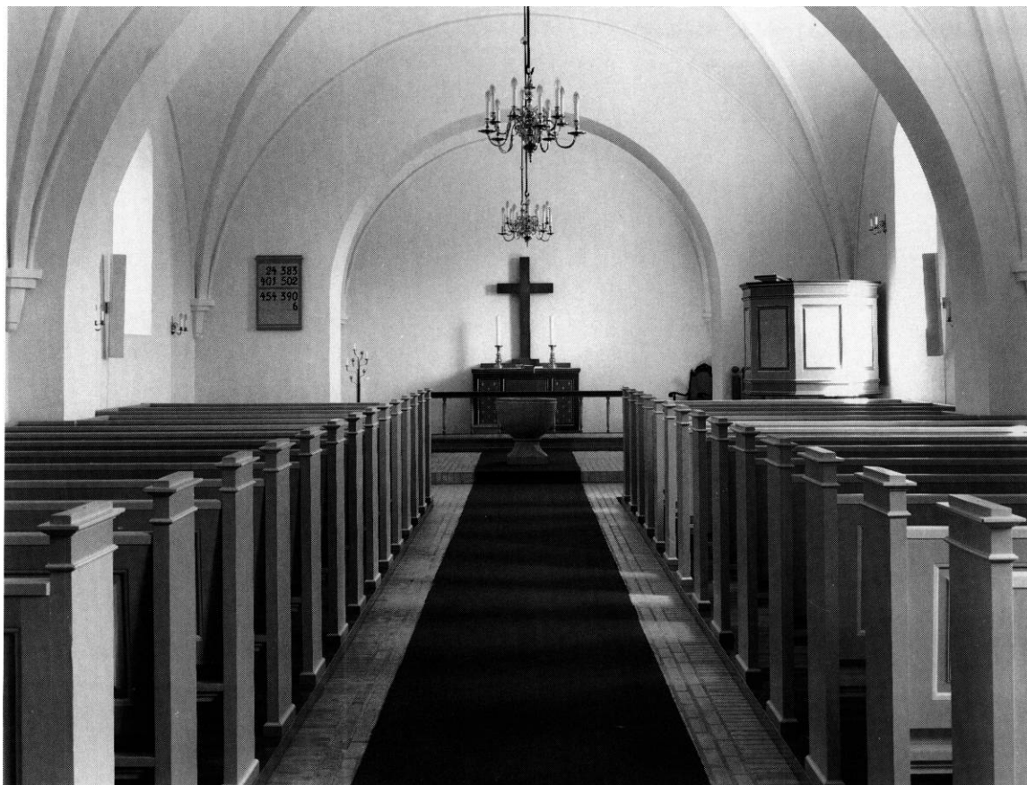
Fig. 2. Indre set mod øst. - Interior to the east.

tårnrummet, er overhvalvet og hvidkalket i alle afsnit. Gulvene er lagt med gule mursten.