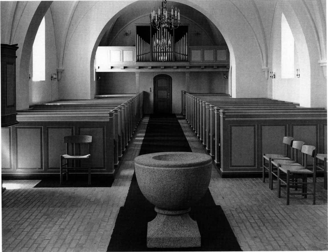
Fig. 3. Indre set mod vest. NE fot. 1994. - Interior to the west. The furniture is contemporary with the building.

Litteratur: MeddÅrhSt. 1979, s. 69 (redskabshus), 1987, s. 126 (omlægning af kirkegård og nyt lågeparti), 1989, s. 162 (nyt lågeparti). Holger Hald: Hampen Kirke, i Kirkerne i Nørre Snede kommune. Udg. af Y's Men's Club Højderyggen, Nørre Snede