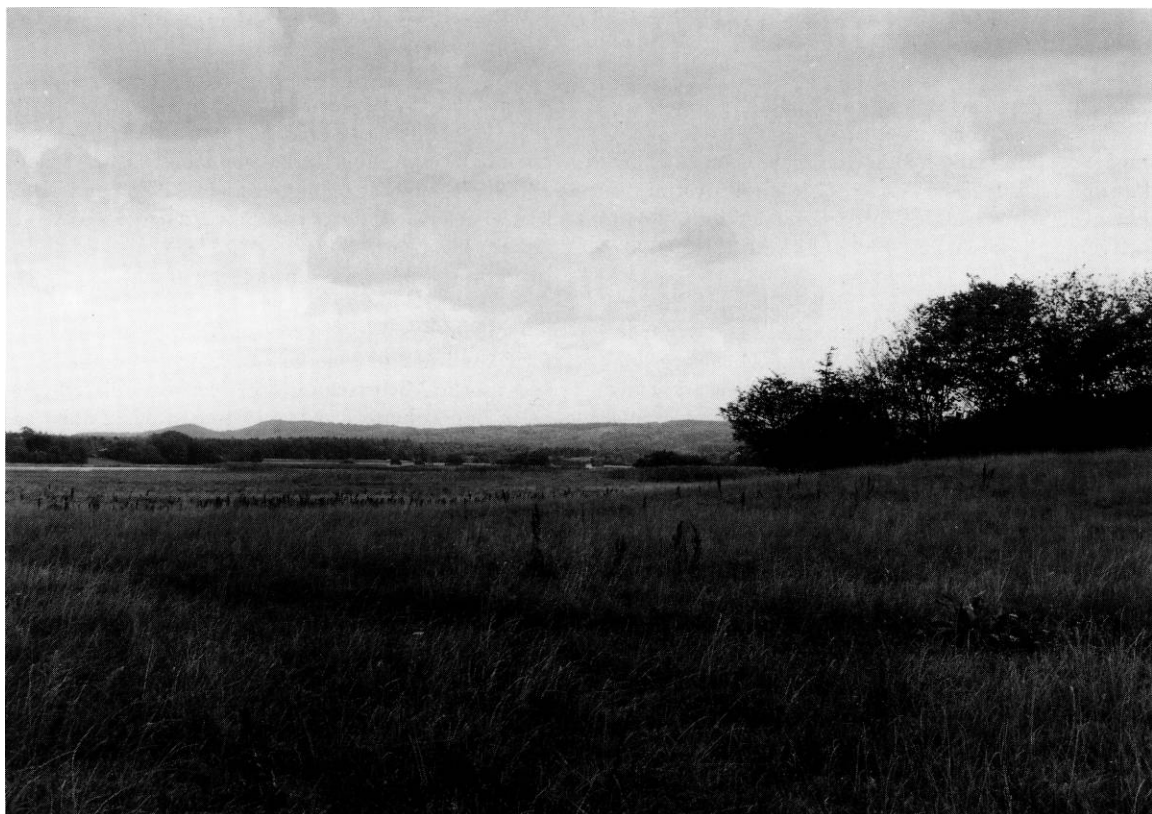
Fig. 1. Landskabet ved Gudenå, syd for Sminge sø, set fra Voel bæk mod nord. Den svage hævning i terrænet i billedets højre side er stedet, hvor Sminge ÷kirke lå. KdeFL fot. 1989. - The area near the river Gudenå where the medieval church of Sminge, demolished in the 16th or the 17th century, has stood.