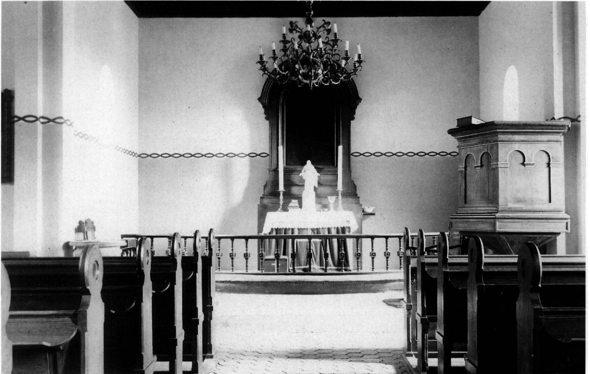
Fig. 2. Indre mod øst. Ældre fotografi i NM2. - Interior to the east before alterations in 1938.

bygning fra 1945 med toilet og materialrum; udvidelse planlagt til 1990.