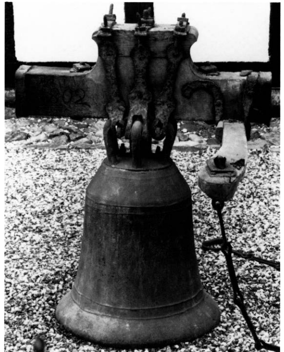
Fig. 2. Klokke fra 1200'nes 1.halvdal, oprindeligt fra Tvenstrup, men efter 1820 overført til Odder kirke. Nu i Odder kirkecenter (s. 2589). LL fot. 1981. - Bell, cast 1200-50, originally for the demolished church of Tvenstrup. After 1820 transferred to the church of Odder. Now in the Odder church centre.

† Alterstager. 1619 6 og 1687 12 fandtes to lysestager af træ. Sidstnævnte år omtales desuden en liden stage af messing samt en gammel