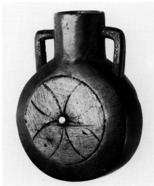
Fig. 3. Middelalderlig *bronzeflaske (ampulla), 7,8 cm høj, fundet på kirkegården ved den nedbrudte kirke (s. 2588). Nu i Nationalmuseet. - Bronze *ampulla, Medieval, 7,8 cm high, found on the churchyard. Now in the National Museum.

9 Kirken har således været omtrent på størrelse med dem i f.eks. Elev (s. 1752) og Randlev (s. 2466). Når der i forbindelse med *altertavlen indsendelse til Oldnordisk Museum nævnes »sakristiet«, synes at sigtes til koret (jfr. s. 2550).