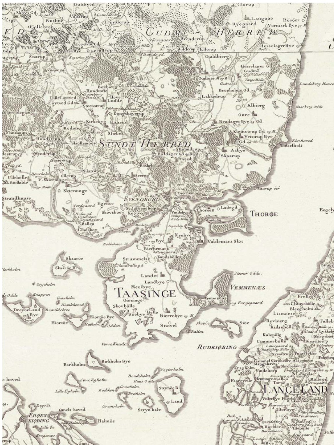
SUNDS HERRED i 1780/1783. Udsnit af Videnskabernes Selskabs Kort (jf. s. 1742). – Map of Sunds district 1780/1783 (cf. p. 1742).