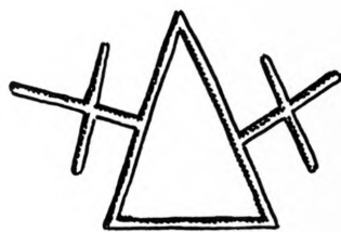
Fig. 3. Bromme. Fontegrydens Støbermærke. 1:2.

Lynge . S. 294, L. 1—4 f. o.; sml. S. 296, L. 1—4 f. o. Kalkmalerierne, der senest maa være fra 1300'erne, viser, at Skibets to østlige Fag maa være bygget allerede i nævnte Aarhundrede og maaske være ældre end Vesthvælvet.