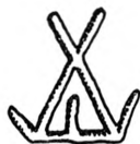
Fig. 5. Gyrstinge. Støbermærke paa Alterstage 1:2.

Stenmagle . S. 408, L. 3 f. o. tilføjes: Sygekalk , vistnok af Næstved Prøvesølv, 12 cm høj, med sekstunget, foldet Fod, sekssidet Skaft, flad Knop med 2 × 6 Blade, og oprindelig Kumme med graveret Versal-Randskrift (»Welsignel-