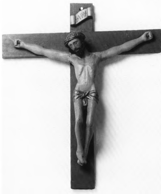
Fig. 9. Krucifiks, bestående af en sandsynligvis senmiddelalderlig figur på et nyere korstræ (s. 2372). NE fot. 1986. – Krucifix, wahrscheinlich spätmittelalterliches Corpus an neuerem Kreuz.

Stolestaderne (jfr. fig. 4 og 6) er fra kirkens opførelsestid, men deres rygge og gavle mod midtergangen ændret, sandsynligvis i forbindelse med moderniseringen af altertavle og prædikestol 1921. Ryggene, tidligere blot et par vandrette planker, er nu helt udfyldte, mens gavlene mod midtergangen har fået det oprindelige, cirkulære topstykke erstattet af trekantgavl over