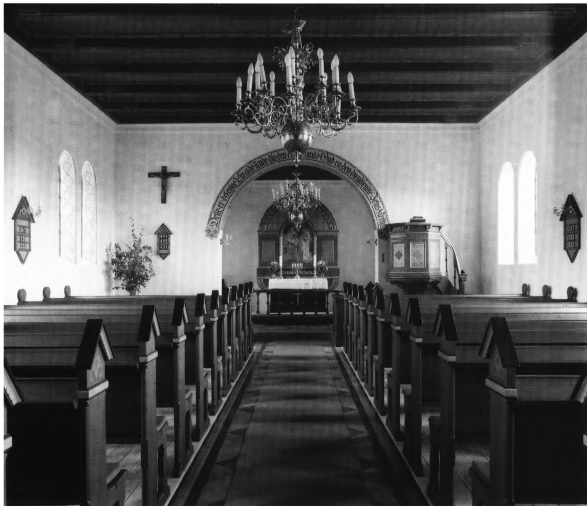
Fig. 4. Indre set mod øst. NE fot. 1986. – Inneres nach Osten.

(†) Altertavle (fig. 5, jfr. fig. 4, s. 2381). Kirkens ældste, fra den gamle bygning overførte tavle, er en ungrenæssanceopbygning fra o. 1590, med malerier fra 1866. Af den nu delvis adskilte tavle er bevaret et postament med fyldingsfremspring, et tredelt storstykke med omtrent kvadratisk, profilindrammet 17 midtfelt og to halvt så brede, tilsvarende indrammede sidefelter. Til midtfeltet hører desuden en frise med dværgpilastre samt en *trekantgavl indrammet af profiler med tandsnit, hvoraf den nedre er beskåret og sandsynligvis sekundært anbragt. Småhuller i sidefelternes øverste rammelister antyder, at også disse har været kronet af trekantgavle, jfr. tavlerne i Øse, Næsbjerg og Hostrup (s. 1612, 1638 og 2043). Til siderne for den