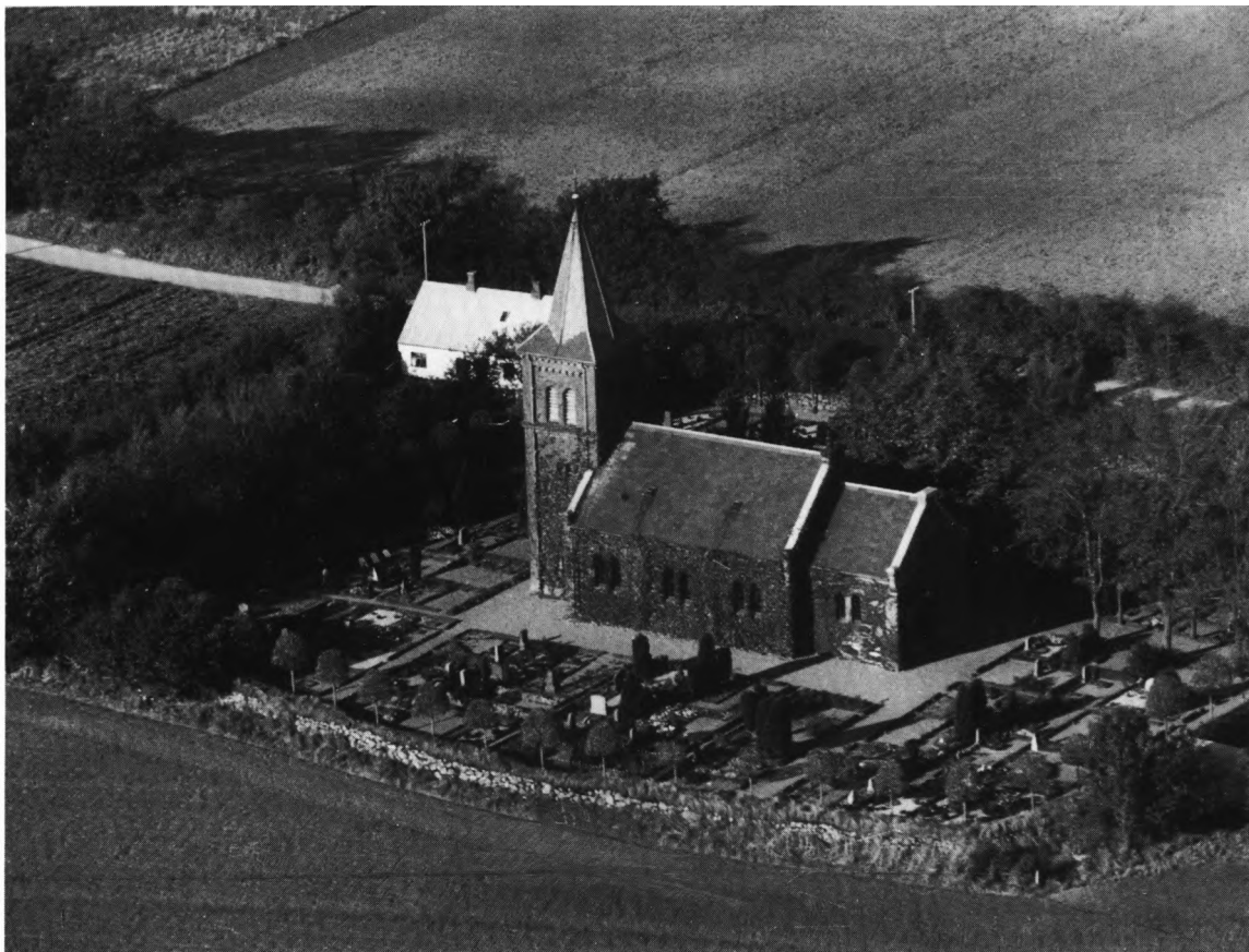
Fig. 1. Luftfoto af kirken og kirkegården, set fra sydøst. Ålborg Luftfoto o. 1950. Det kgl. Bibliotek. – Luftaufnahme von Kirche und Friedhof. Südostansicht.