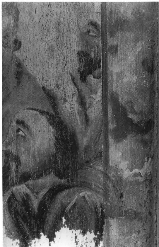
Fig. 12. Detalje af nadverfremstilling malet 1688 i midtfeltet på kirkens (†)renæssancealtertavle, jfr. fig. 5 (s. 2369). NE fot. 1986. – Ausschnitt aus Abendmahlsbild 1688. Mittelfeld des (†)Renaissance-Gemäldealtars, vgl. Abb. 5.

Historisk indledning ved Michael H. Gelting, bygning ved Niels Jørgen Poulsen, kalkmalerier og inventar ved Ulla Kjær, orgler ved Ole Olesen og gravminder ved Vibeke Andersson Møller. Tysk oversættelse: Bodil Moltesen Ravn. Redaktionen afsluttet november 1991.