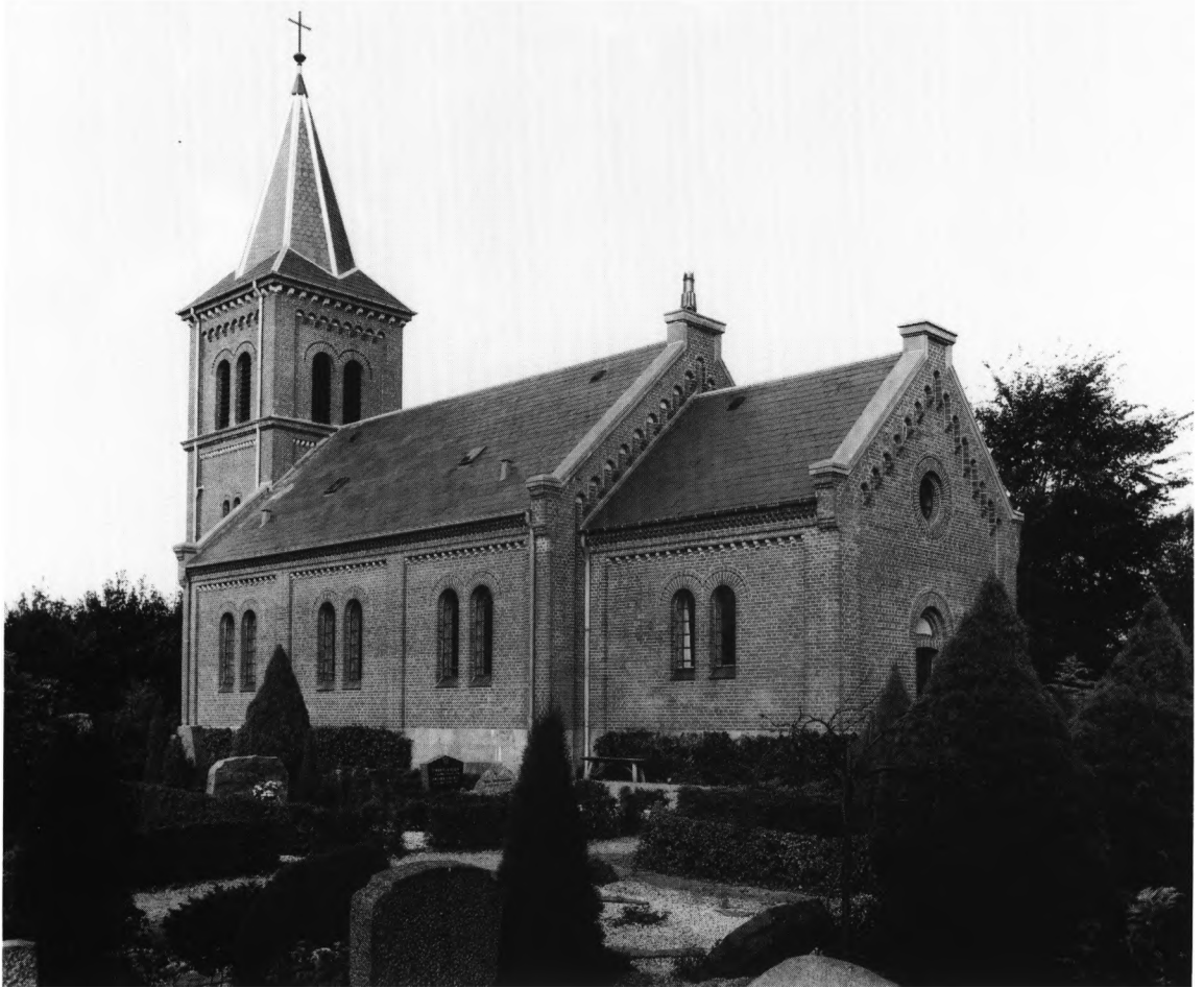
Fig. 3. Kirken, opført 1896, set fra sydøst. NE fot. 1986. – Südostansicht der Kirche, 1896 errichtet.

selve kirken og et skifte under tårnet. Kvadrene, hvoraf det nederste skifte har skråkantled, er op-hugget og uniformeret i forbindelse med ny-byggeriet, men spredt i soklen ses endnu gamle sokkelkvadre med rundstav og hjørneknop led-saget af en indhugget, vandret linie. Kragste-nene fra den gamle kirkes korbue (s. 2379) synes anvendt i korets østre hjørner.