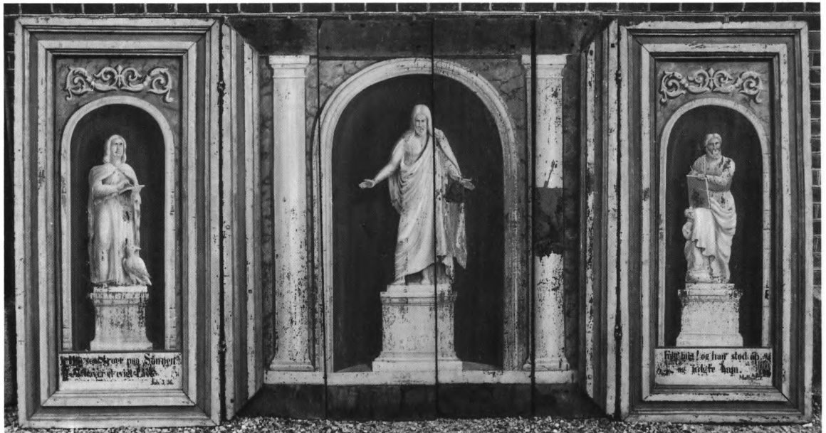
Fig. 5. (†) Altertavle fra o. 1590, med malerier fra 1866. Yderst til højre på midtfeltet ses et afrenset parti af en (†)staffering fra 1688, jfr. fig. 12 (s. 2369). NE fot. 1986. – (†)Altar um 1590. Gemälde 1866. Ganz rechts im Mittelbild eine gereinigte Partie einer (†)Bemalung 1688, vgl. Abb. 12.

Altersølvet består af dele fra forskellig tid. Kalken (fig. 7) fra 1782 er udført af Jacob Nielsen