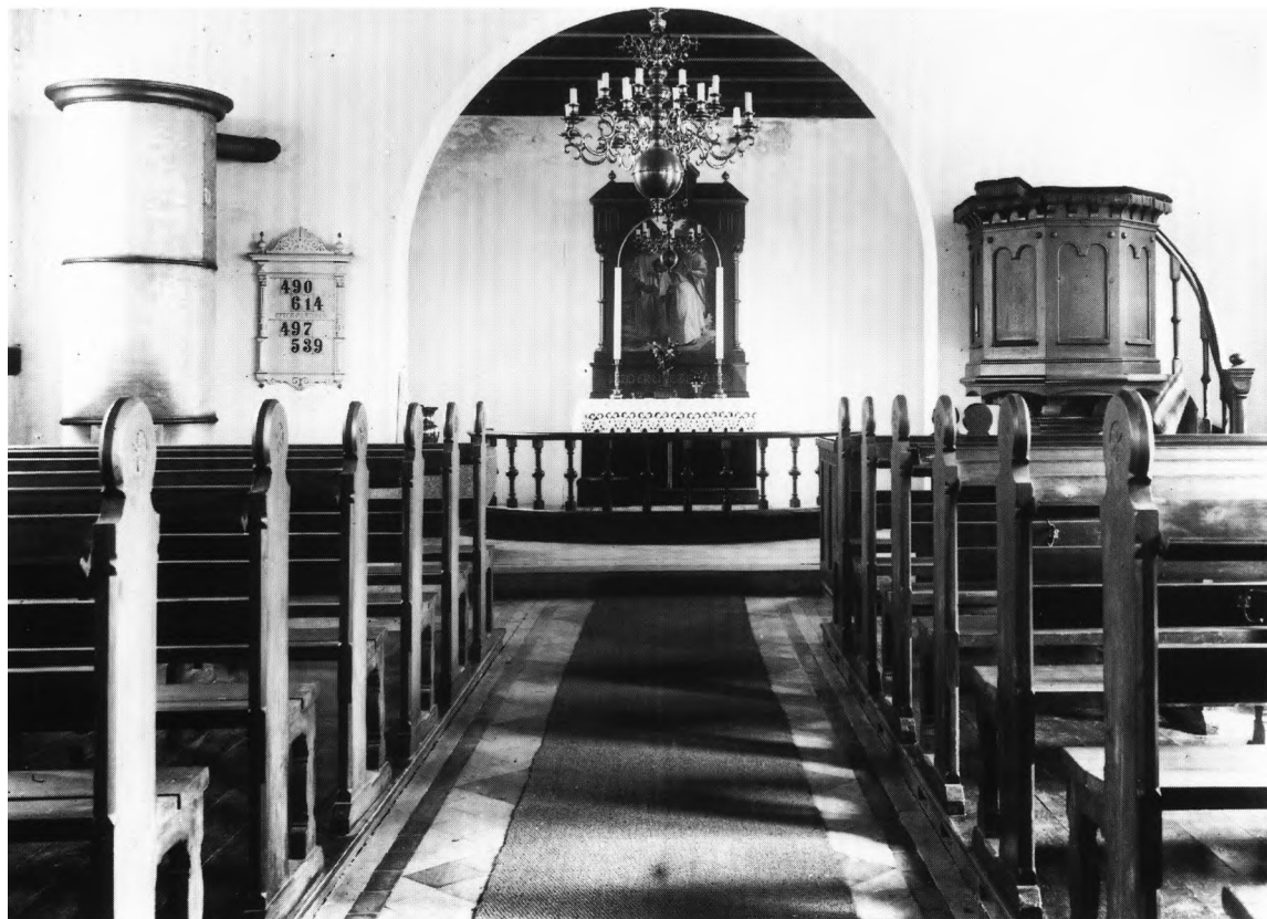
Fig. 6. Indre set mod øst før 1921. – Inneres nach Osten vor 1921.