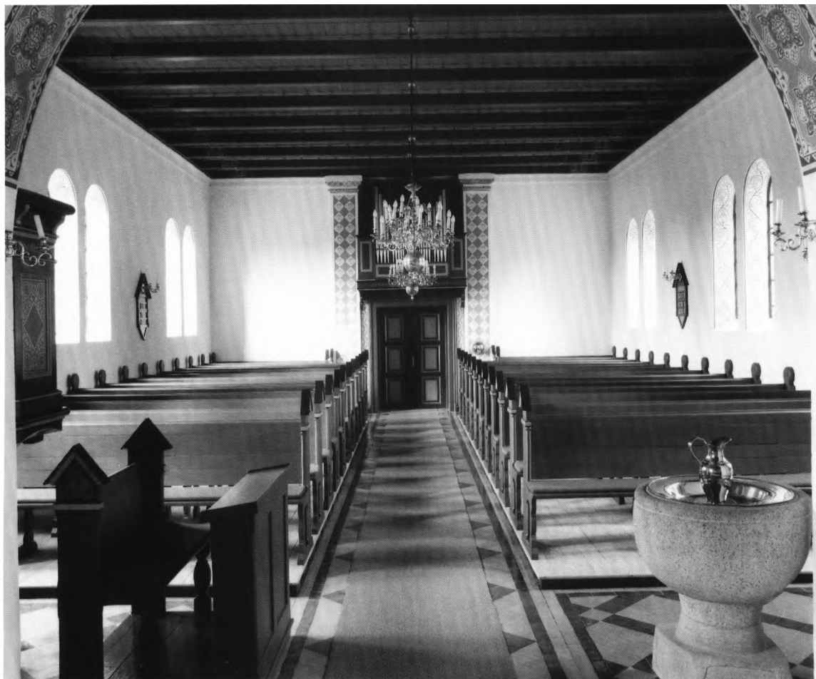
Fig. 11. Indre set mod vest. NE fot. 1986. – Innes nach Westen.

skrevet i hvid kursiv, mens den anden, der ligger på loftet, har rester af grå bemaling.