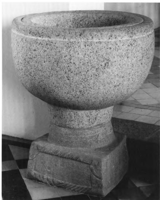
Fig. 10. Døbefont sammensat af en romansk granitkumme og en cementfod, der synes udført som en efterligning af den oprindelige i forbindelse med fontens overførsel til den nye kirke 1896 (s. 2372). – Eine aus der früheren Kirche überkommene romanische Granittaufe mit Zementfuss. Der Fuss ist wahrscheinlich in Verbindung mit der Überführung 1896 als eine Kopie vom Original ausgeführt worden.