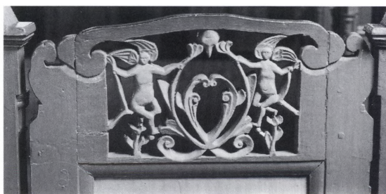
Fig. 4. Topstykke til låge fra et (†)stoleværk, måske udført i 1700'ernes første del (s. 2170). – Kartusche von Tür eines (†)Gestühls, vielleicht erste Hälfte des 18. Jahrhunderts.