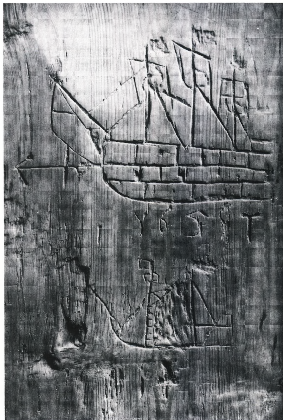
Fig. 2-3. Fyldinger fra et (†)stoleværk med graffiti dateret 1659 (s. 2170). NE fot. 1984. – Füllungen eines (†)Gestühls mit Ritzen und Datum 1659.

s. 2167. Stod o. 1745 i korets nordside, tæt op ad skriftestolen. 2 – »Dåbsfad, skænket 1775, se s. 2167.