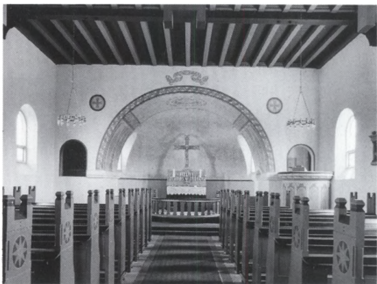
Fig. 3. Stenderup kirke. Indre set mod øst. NE fot. 1988. – Innenansicht nach Osten.

I det indre prydes den brede, lavtspændte korbuue af omløbende kragbånd. Skibet dækkes af fladt træloft: mindre, langsgående bjælker, hvilende på svære tværbjælker. I gulvet er bevaret det oprindelige, mønstrede flisegulv, nu dækket af tæpper. Det halvkuppelformede apsishvælv smykkes af en kalkmalet dekoration , fra 1911, symboliserende evigheden eller Edens have. I grå rankeslyng på hvid baggrund er indflettet tovl hvidklædte personer, seks mænd og seks kvinder.