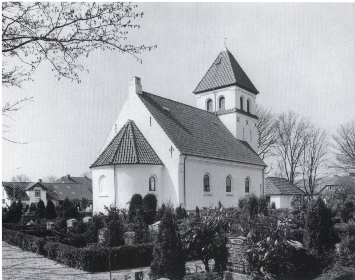
Fig. 1. Kirken set fra nordøst. NE fot. 1988. – Nordostansicht.