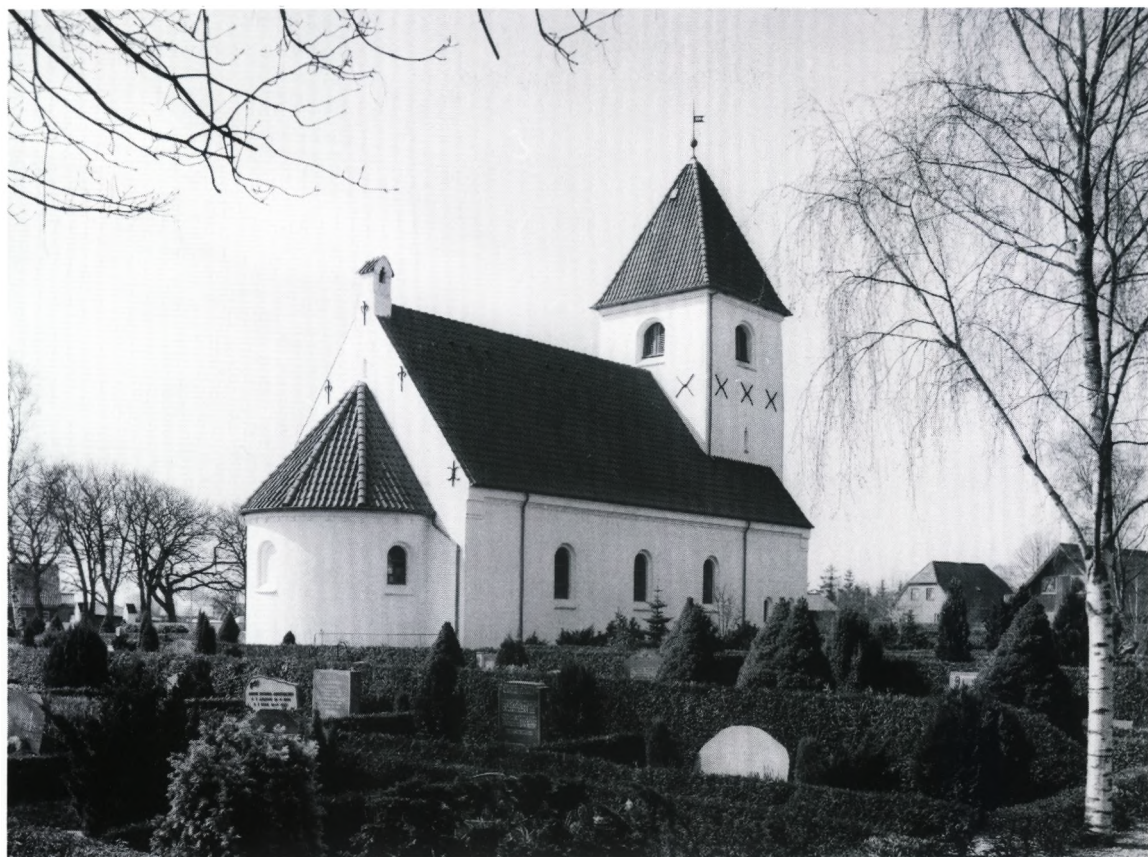
Fig. 1. Kirken fra nordøst. NE fot. 1988. –. Nordostansicht.