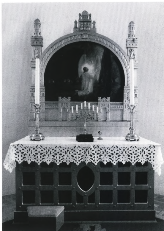
Fig. 3-4. 3. Indre set mod vest. 4. Alterparti med maleri, Getsemane, af Hans Agersnap (s. 1594). – 3. Kircheninneres nach Westen. 4. Partei vom Altar mit Gemälde.

Et krucifiks , Kristusfiguren i galvanoplastisk arbejde, 85 cm høj, korset i blankt egetræ med fod, er egentlig et alterkrucifiks; ophængt på skibets nordvæg.