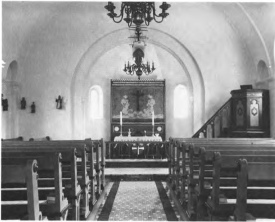
Fig. 3. Indre set mod øst. NE fot. 1981. — Intérieur gegen Osten gesehen.