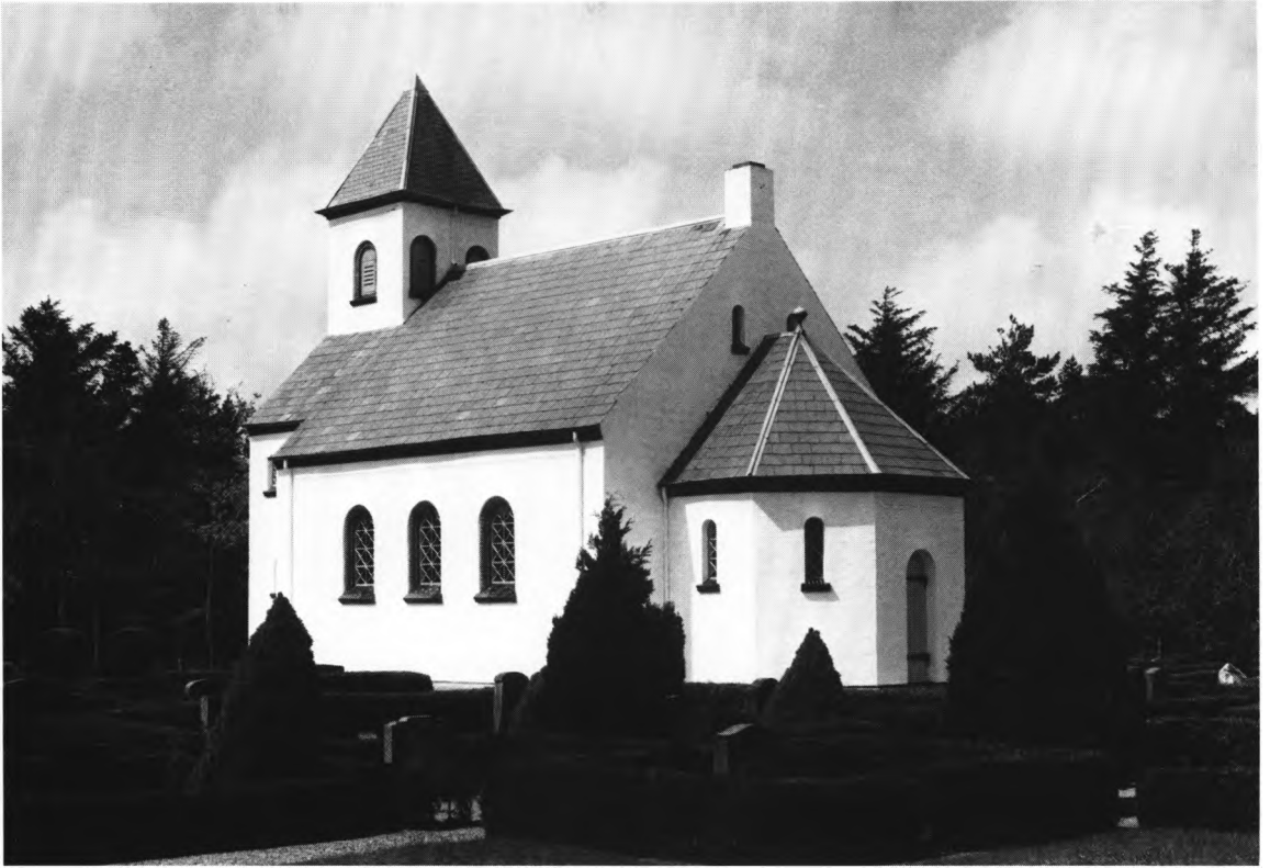
Fig. 1. Kirken set fra sydøst. — Die Kirche von Südosten gesehen.