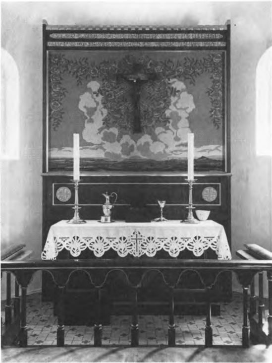
Fig. 4. Alterparti med broderi efter tegning af Martin Nyrop. NE fot. 1981. — Altarpartie mit Stickerei nach Zeichnung von Martin Nyrop.

med korsmærke og herover et cirkelvindue. Rummet dækkes af et lavt spændt tøndehvæl af træ; den brede, runde korbue har små prydsøjler med terningkapitæler.