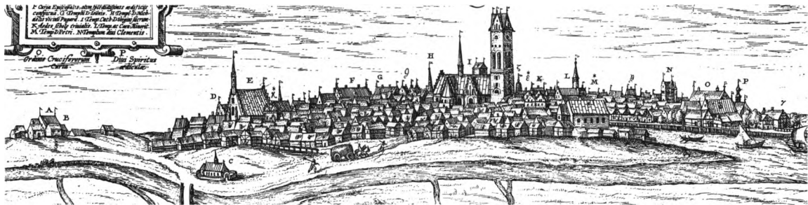
Fig. 1. Prospekt af Ribe, trykt 1598, med afbildning af bevarede og forsvundne middelalderkirker. A-B: S. Nikolaj kirke og kloster. C: Hellig Gravs kirke. D-E: S. Katrine kirke og dominikanerkloster. G: S. Hans kirke. H: S. Miksels kirke. I: Domkirken. L: S. Laurentius' kirke og franciskanerkloster. M: S. Peders kirke. N: S. Klemens kirke. O: Johanniterkloster. P: Helligåndshuset. — Efter G. Braunius: Theatrum urbium . — Prospekt von Ribe, gedruckt 1598 mit Abbildung erhalten gebliebener und verschwundener mittelalterlicher Kirchen. A-B: St.-Nikolaj-Kirche und -Kloster. C: Kirche zum Heiligen Grab. D-E: St.-Katrinen-Kirche und Dominikanerkloster. G: St.-Hans-Kirche. H: St.-Michaels-Kirche. I: Dom. L: St.-Laurentius-Kirche und Franziskanerkloster. M: St.-Peters-Kirche. N: St.-Klemens-Kirche. O: Johanniterkloster. P: Heiliggeisthaus. — Nach G. Braunius: Theatrum urbium .