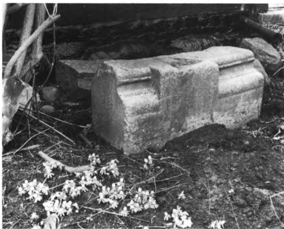
Fig. 3. Apsis-sokkelkvader af granit (nr. 1, s. 860) fra en af Ribes romanske \dagger kirker. EN fot. 1984. — Apsis-Sockelquader aus Granit aus einer der romanischen \dagger Kirchen von Ribe.

ling i Ribe og rundt om i byens huse og haver må formodes at stamme fra de forsvundne kirker (jfr. fig. 3). Det samme gælder nogle romanske døbefonte og granitgravsten. Den eneste væsentlige inventargenstand , hvis proveniens kendes, er en klokke fra S. Nikolaj, nu i S. Katarine kirke. Af gravminder kan fremhæves et (nu forsvundet) brudstykke af låget til en romansk sandstensarkofag fra S. Klemens kirke. Ellers må vor viden om de middelalderlige kirker og deres indretning i det væsentlige hentes i de ret fåmælte skriftlige kilder.