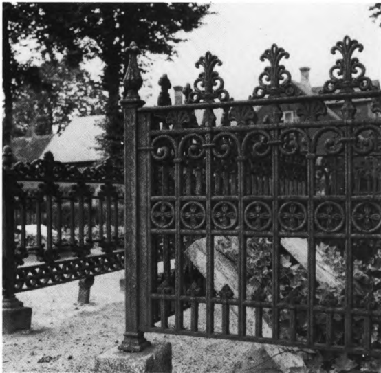
Fig. 6. Kirkegården på S. Hans Holm, gravgitter af støbejern. — Vom Friedhof auf der Insel St. Hans Holm, Grabgitter aus Gußeisen.