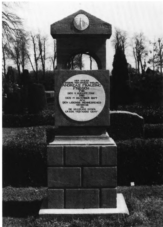
Fig. 5. Kirkegårdsmonument (nr. 2, s. 815), o. 1807, for Andreas Frausing Fridsch. LL fot. 1980. — Friedhofsdenkmal, um 1807, für Andreas Frausing Fridsch.