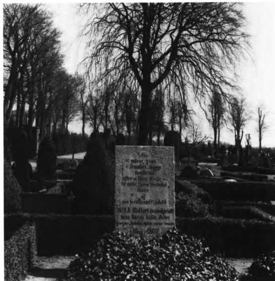
Fig. 4. Kirkegårdsmonument (nr. 1, s. 814), o. 1807, for Elisabeth Moltke. — Friedhofsdenkmal, um 1807, für Elisabeth Moltke.

7) O. 1831. Christian Carl Bjerrum, født 12. febr. 1769 på Olufgaard ved Warde, †27. april 1831 i Ribe. I året 1793 tog han borgerskab som