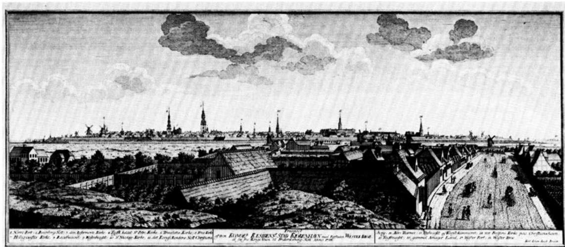
Fig. 1. Prospekt af København, set fra Vesterbro, 1760, med Vajsenhuset (nr. 9) og Tugthuset (nr. 15). Ladegården ligger umiddelbart uden for billedet til højre, Pesthuset til venstre. Stik af Hans Quist efter Johan Jacob Bruun. NM2. – View of Copenhagen, seen from Vesterbro, 1760. The Royal Orphanage and the Workhouse are seen (nos. 9 and 15). The Granary is placed just outside the picture to the right, and the Pesthouse to the left. Print by Hans Quist after Johan Jacob Bruun.