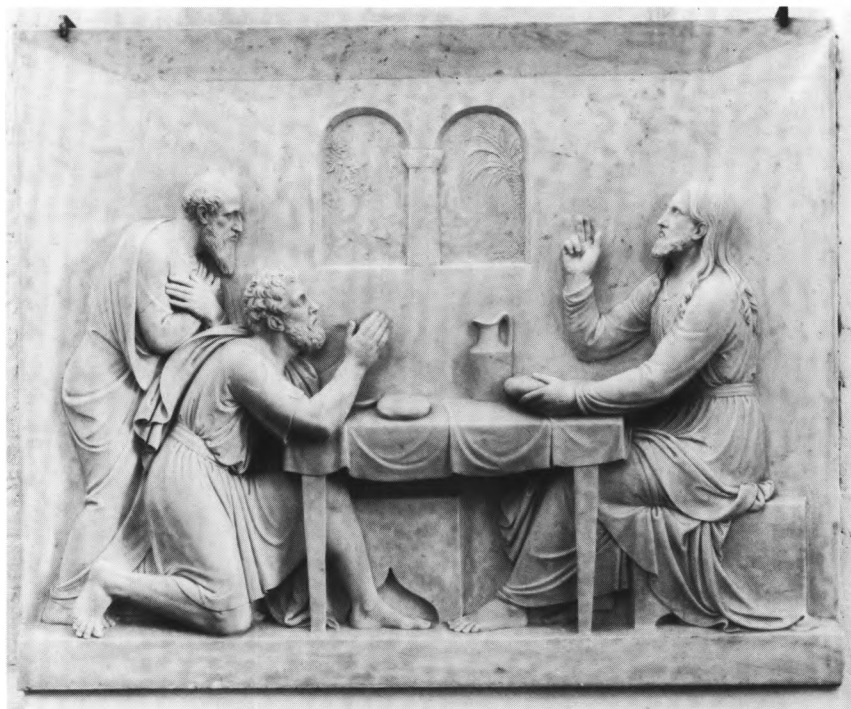
Fig. 9. Kristus i Emmaus. Alterprydelse af marmor efter Thorvaldsens relief fra 1839 (s.287). — Christ at Emmaus. Altar ornament of marble after Thorvaldsen's relief

stået frit, før en ca. 40 cm dyb påmuring af munkesten i usikker skiftegang blandet med romanske frådrenskvadere tilføjedes. Samtidig er de to øverste af det oprindelige bords skifter ommuret. I sydsiden, 46 cm fra væggen, ses en niche , hvis trappestikformede åbning måler 52x32 cm, dybde 59 cm. I bordets overside findes en næsten kvadratisk helgengrav , ca. 29x ca. 28 cm, dækket af en gråspættet, rødlig Ølandskalksten, og nu skjult af alterbordspladen. Graven havde tidligere været åbnet og rummede kun rester af blykapslen.