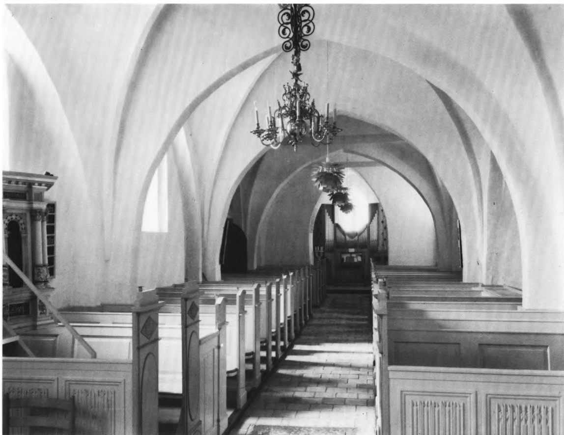
Fig. 5. Indre, set mod vest. LL fot. 1976. — Interior to the west.

hvor der er ankerbjælker af træ. Ved den omtalte storm natten efter tårnets fald skal kirkens tag have mistet sin beklædning af bly. Den må dog være blevet oplagt igen, for 1803 20 siges kirken at være blytækket, bortset fra tårn, trappehus og 3-4 alen af kirken, som er med stentag. 1817 22 gennemgik kirken en hovedistandsættelse, men året efter hærgedes den af en brand, der bredte sig fra den nærliggende degnebolig. For bygningsens vedkommende medførte ildsvåden, at taget måtte fornyes; kirkeejeren fik tilladelse til at benytte det smeltede bly og lod opsætte nyt tagværk med stentag. De spidsbuede, afsprossede trævinduer, som er indsat i samtlige vinduesåbninger, stammer antagelig fra tiden o. 1850; tilsvarende vinduer er benyttet i annekskirken. Samtidig hermed er formentlig et spidsbuet, falset vindue i skibets nordside.