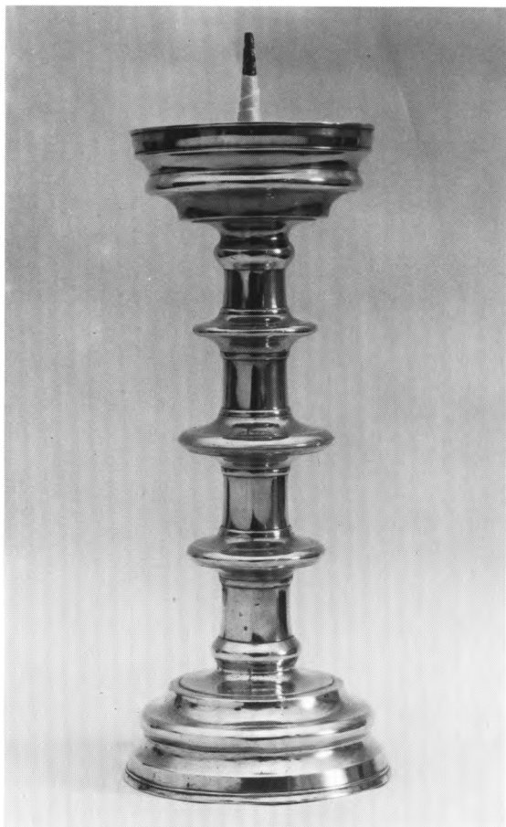
Fig. 10. Alterstage (s.288). — Altar candlestick.

161) 29 , tillige med endnu et stempel, som enten er et mislykket mesterstempel eller to oven i hinanden, må stamme fra 1662.