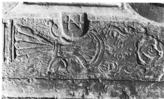
Fig. 22. Signatur på epitafium fra 1596 over Erik Krabbe, sml. fig. 17 (s. 296). NE fot. 1980. — Signature on wall-monument from 1596 to the memory of Erik Krabbe.

14) O. 1864. Waldemar Krieger, ejer af Nyvangsgaarden, *14. jan. 1828, †27. sept. 1864. Marmortavle i sandsten.