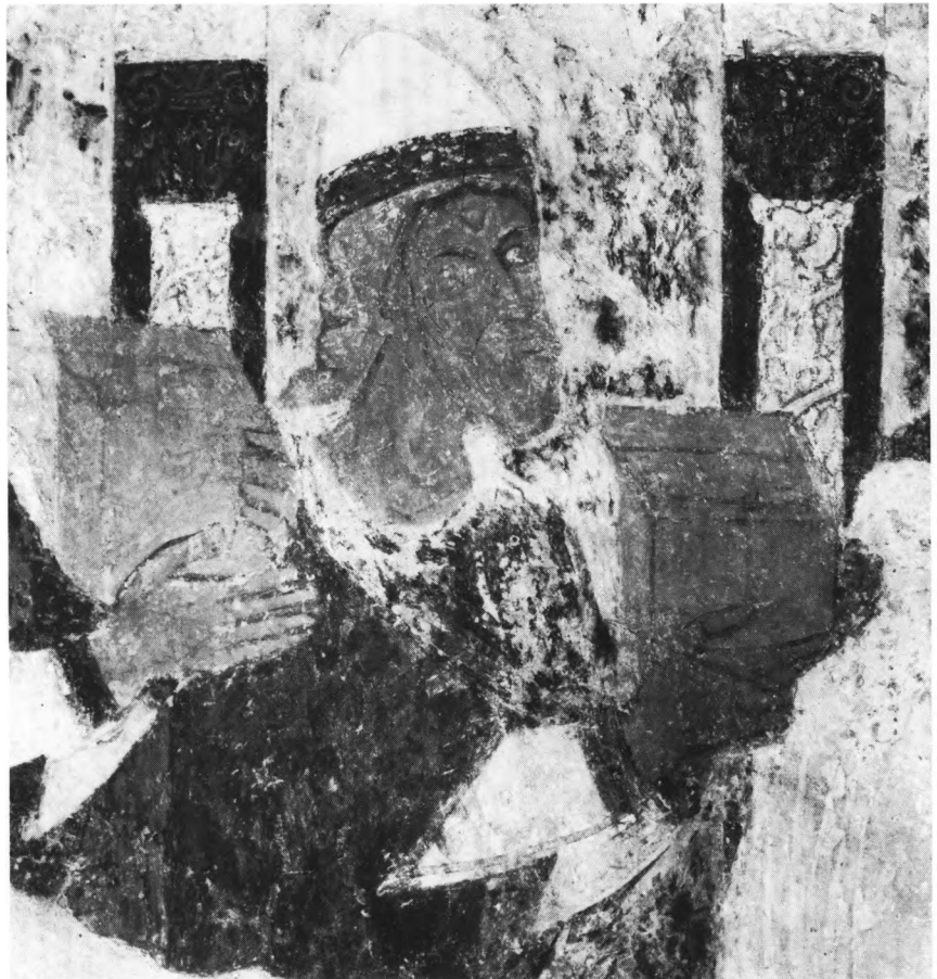
Fig. 7. Kongernes tilbedelse. Detalje af romansk kalkmaleri på skibets sydvæg, sml. fig. 8 (s. 284). Robert Smalley fot. 1970. — The Adoration of the Magi. Detail of romanesque wall-painting on the south wall of the nave (cf. fig. 8).