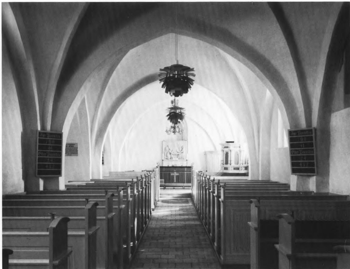
Fig. 4. Indre, set mod øst. — Interior to the east.

m.s højde, der markeres af et spring i kapellets indvendige vægge. Murene, som hviler på en syld af marksten, er af munkesten i munkeskifte, og 1968 påvistes små fladbuede gemmenicher, to i hver af de bevarede vægge. Spor af den østre vange i sakristiets kordør sås i resterne af fundamentet fra langhuskorets nedbrudte nordmur, hvor døren skønnedes at være sekundær.