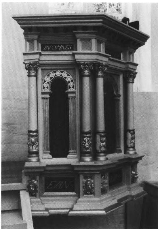
Fig. 15. Prædikestol, med reliefskåret årstal 1599 (s. 291). — Pulpit executed in 1599.

Rester af en degnestol står i korets sydøsthjørne. Dens nuværende indretning stammer fra 1923 7 , da en tilsvarende præstestol i nordøsthjørnet fjernedes. De to stole, som kendes fra ældre fotografier, opstilledes samtidig med altersranken o. 1825-50. De dannedes af en