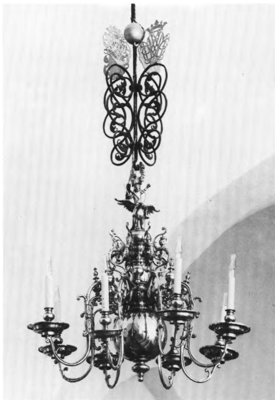
Fig. 16 a-b. a. Lysekrone (s. 292). LL fot. 1976. — Chandelier . b. Detalje af lysekrone. LL fot. 1976. — Detail of chandelier .

Uret synes at være identisk med et, der 1803 omtales som gammelt i Kirke Saaby kirke, og som 1820 tillodes flyttet til Soderup 53 .