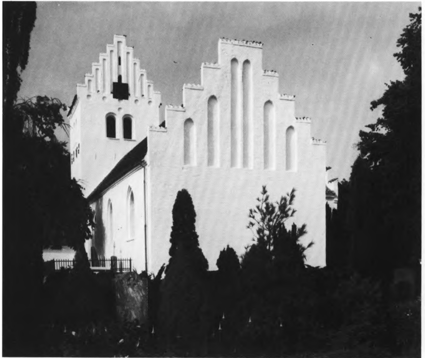
Fig. 3. Ydre, set fra syd- øst. LL fot. 1976. — Ex- terior seen from the south- east.

hvidkalkede bygning, der 1973 overgik i kirkens eje og nu fungerer som privat beboelse, har teglhængt sadeltag og en gesims, svarende til gesimserne på kirkens tårn og våbenhus fra 1725. - Ligkapellet i nordvesthjørnet er opført 1896 10 af kommunen og står hvidkalket med kamtakkede gavle i nord og syd. I nordenden er indrettet toilet og redskabsrum som erstatning for det 1906 7 opførte †nødtørftshus og †brændelseskur , der endnu i 1960'erne lå i nordvesthjørnet.