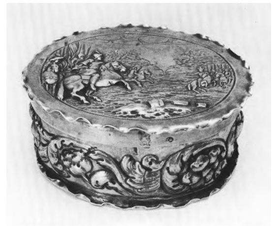
Fig. 13. Oblatæske (s.288). LL fot. 1976. — Wafer box .

Dåbskande manglede 1862 10 , fra 1885 brugtes den tidligere alterkande af tin. 1896 trængte den