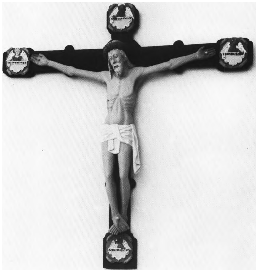
Fig. 14. Korbuekrucifiks (s. 290). — Chancel arch crucifix.

til at repareres og blev det muligvis 7 . Den kan tænkes at være kommet til Kirke Eskilstrup.