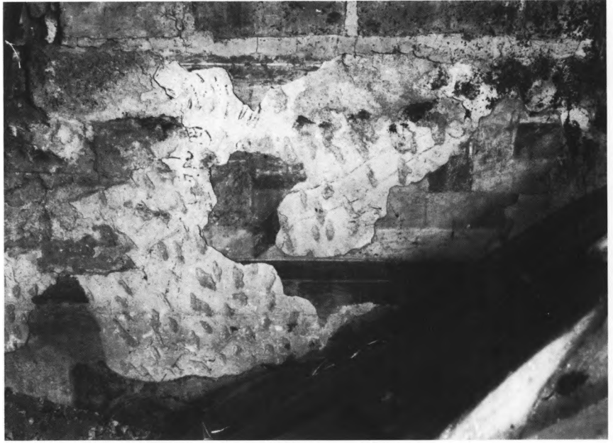
Fig. 6. Djævel. Skitse under romansk kalkmaleri på skibets søndre overvæg (s.284). LL fot. 1976. — Devil. Sketch under, the romanesque wall-painting on the south wall of the nave above the vaults.