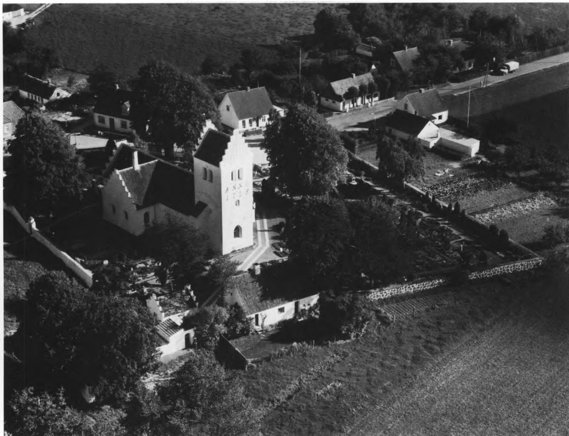
Fig. 1. Kirken og kirkegården, set fra luften. 1961. — The church and churchyard seen from the air.