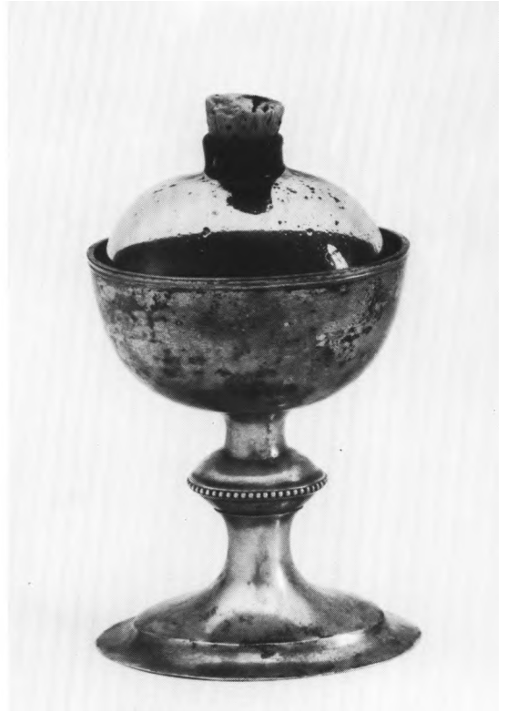
Fig. 11-12. 11. Alterkalk (s. 287). — Altar chalice. 12. Sygekalk med vinflaske (s. 288). — Chalice for the sick with wine bottle.

lys 45 . Syvarmet stage (Titusstage), svarende til Kirke Eskilstrups, skænket 1932.