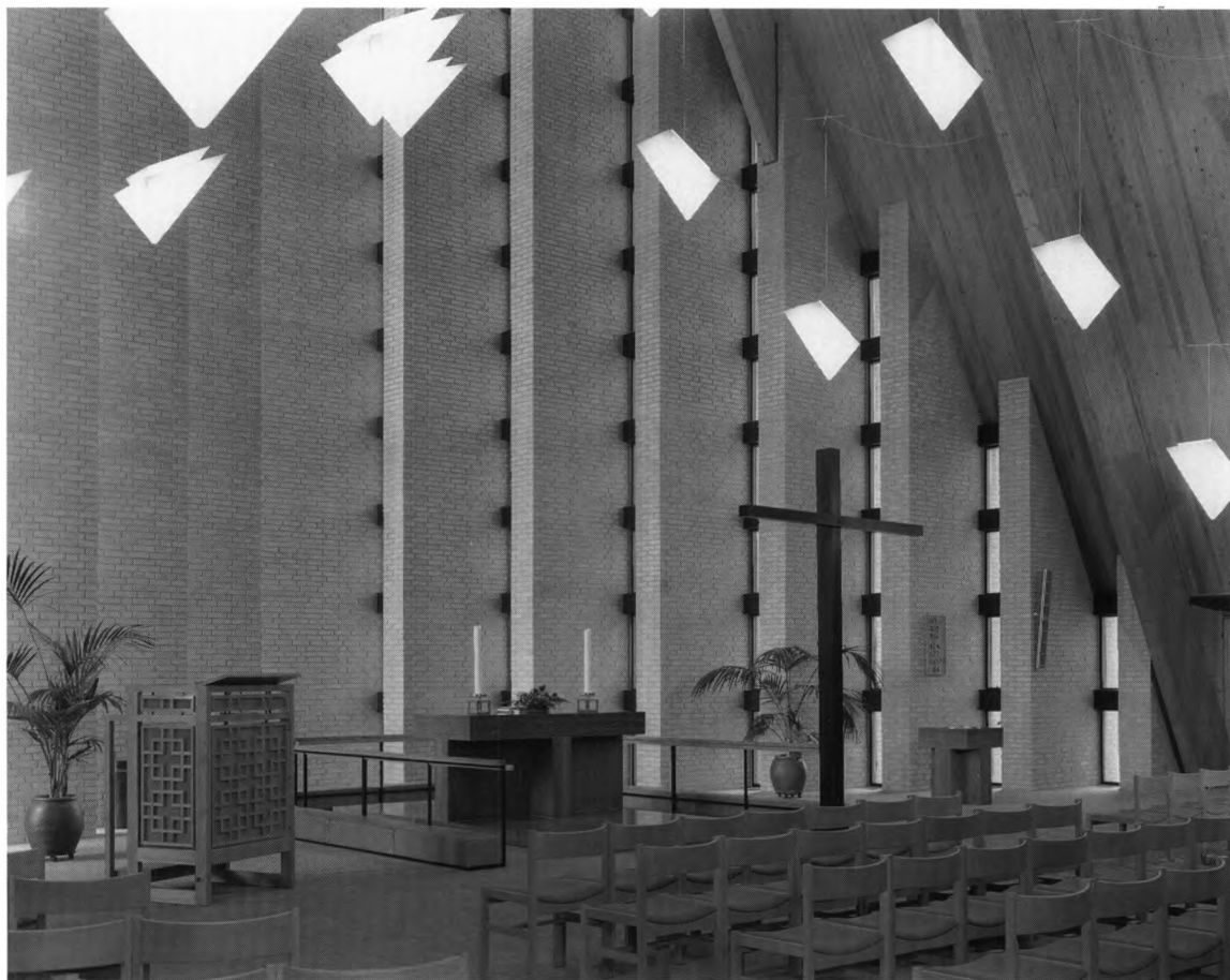
Fig. 4. Indre, set mod syd. - Interior to the south.