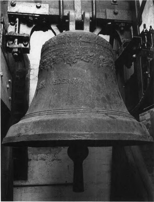
Fig. 4. Klokke støbt 1725 af Friderich Holtzmann, København (s. 2944). NE fot. 1994. - Bell cast in 1725 by Friderich Holtzmann, Copenhagen.

mission). 9 Pneumatisk aktion. Den pibeløse facade, af bejdsset fyr med gitterværk af drejede balustre, er genanvendt til det nyanskaffede orgel 1974.