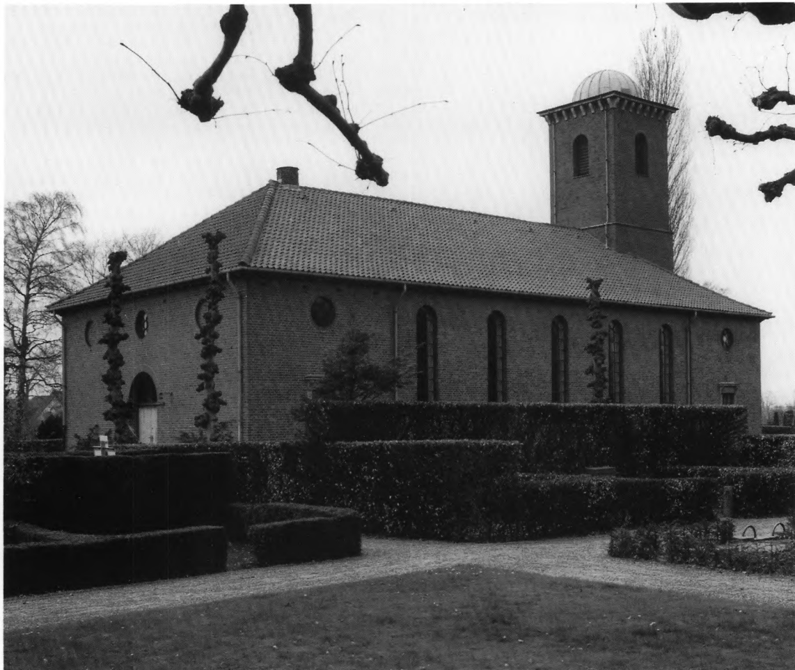
Fig. 1. Østre kapel, set fra nord. 1928. - East chapel seen from the north.