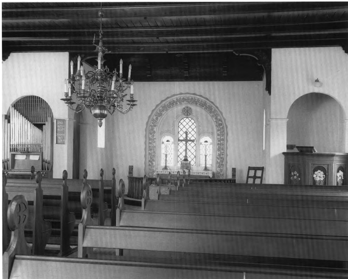
Fig.1. Indre set mod vest. - Interior to the west.