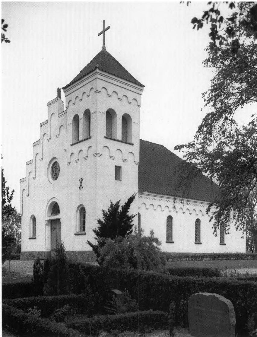
Fig.2. Ydre set fra nord-øst. NE fot. 1990. - Exterior from the north-east.

vinduer, hvoraf det midterste er størst. Indadtil er de anbragt i en flad, falset, rundbuet niche. Hovedindgangen er fra øst gennem en kvartsøjleprydet portal hvorover en halvcirkulær lynette; til hver side for døren er et falset, rundbuet vindue.