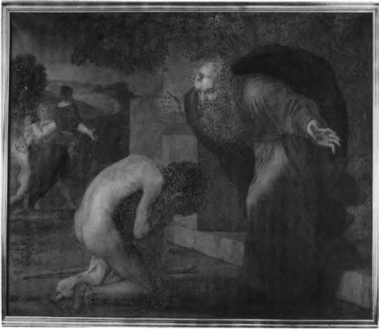
Fig. 4. Maleri udført 1882 af Jørgen Roed efter tegning fra 1867 af sønnen Holger. Tidligere i \dagger altertavle (s. 2512). NE fot. 1992. - Painting by Jørgen Roed 1882, after a drawing made in 1867 by his son Holger. Formerly in \dagger alter-piece.

Altersølv , fra 1882, udført af Johan Georg Christian Holm, København. Den enkle kalk er 24 cm høj, har cirkulær fod og flad knop med fire bosser hvorpå graveret: »Inri« og bæger med hældetud. Under bunden ses graveret skrivekrift: »Fra kvinderne i vor egen lille kreds 1882«, og tre stempler: mestermærke med fordybede versaler J. Holm (Bøje 1056), Københavnsmærke (18)82 og gardeinmærke for Simon Groth. Disk en er 15 cm i tv. og har under bunden stempler som kalkens. En lille ske , antagelig den der anskaffedes 1895, 1 stemplet CL samt 425. Oblatæsk en er cylinderformet, 4 cm høj og 7,5 cm i tv. Under bunden stempler som kalkens, dog er mestermærket gentaget. Alterkanden er 32 cm høj og har graveret latinsk kors på korpus. Under bunden graveret skrivekrift: »Fra eleverne paa Vallekilde højskole sommeren 1882« og stempler som kalkens.