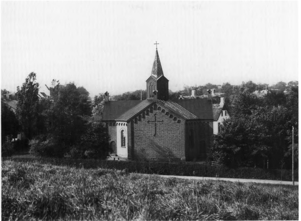
Fig. 1. Ydre set fra øst. o. 1900. - Exterior from the east.