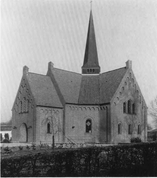
Fig. 2. Ydre set fra sydvest. - Exterior from the south-west.

et lavt klokkekammer. Kirkens indre er hvidkalket og overdækkes efter ombygningen af grathvælv, hvoraf det midterste er højt og kuppelt. De pudsede træhvælve bæres af de oprindelige, ottekantede, nu ligeledes pudsklædte, træ søjler.