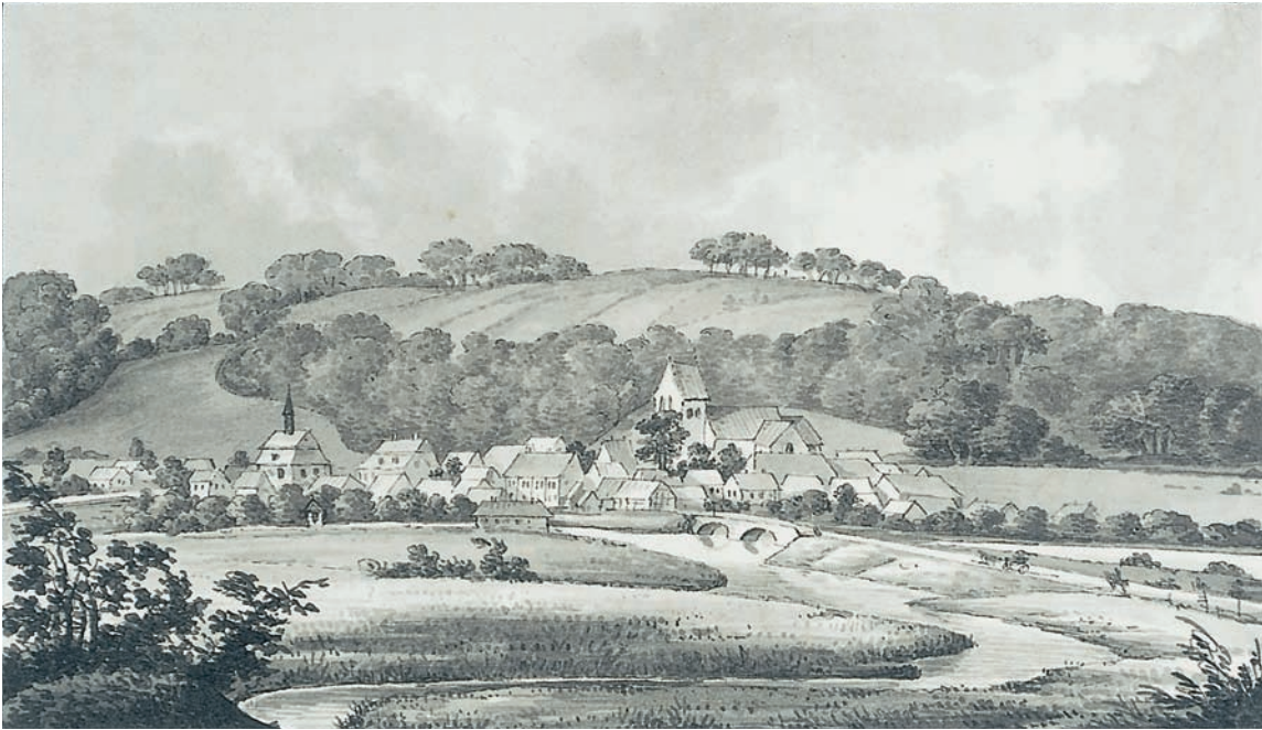
Fig. 1. Vejle set fra sydvest 1821. I forgrunden Vejle Å (Sønderå) og Sønderbro. Skt. Nikolaj Kirke står med sit senmiddelalderlige tårn. Tv. ses det gamle rådhus (med spir), opført 1780 nær det sted, hvor tidligere †Sortebrødreklostret lå. Laveret tuschtegning ved J. H. T. Hanck i KglBibl. – Vejle viewed from the south west, 1821. In the foreground the river Vejle Å (Sønderå) and Sønderbro. The St. Nikolaj Church stands with its Late Medieval tower. Left: The old Town Hall (with spire), built in 1780 near the site of the former †Dominican Monastery.