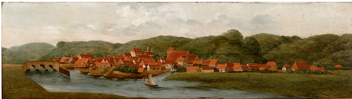
Fig. 3. Prospekt af Vejle set fra sydøst 1838. I forgrunden Mølleåens udmunding. Oliemaleri på dørstykke i Vejle Museum. – View of Vejle from the south east, 1838. In the foreground, the mouth of the Mølleå river.

Vejle 1256 blev valgt til mødested for Danmarks samlede gejstlighed. Resultatet af det berømte kirkemøde 1256 blev den såkaldte Vejlekonstitution, som fastslog reglerne for kirkens ret og frihed og dermed skærpede den længevarende ‘kirkekamp’ mellem konge og ærkebiskop. 5 Valget af byen til dette betydningsfulde møde skyldes formodentlig ikke blot Vejles centrale beliggenhed midt i det danske rige med bekvem adgang fra havet. Mødet har formodentlig også forudsat, at byen havde nået en sådan udvikling, at den kunne yde passende faciliteter – herunder en præsentabel kirke til de fælles gudstjenester. Hvor langt fremme i sin opførelse Skt. Nikolaj Kirke var 1256, lader sig dog ikke nærmere afgøre (jf. s. 98). Vejle blev for anden gang vært for et kirkemøde i 1279, da ærkebiskoppen holdt et provins-koncilium i byen.