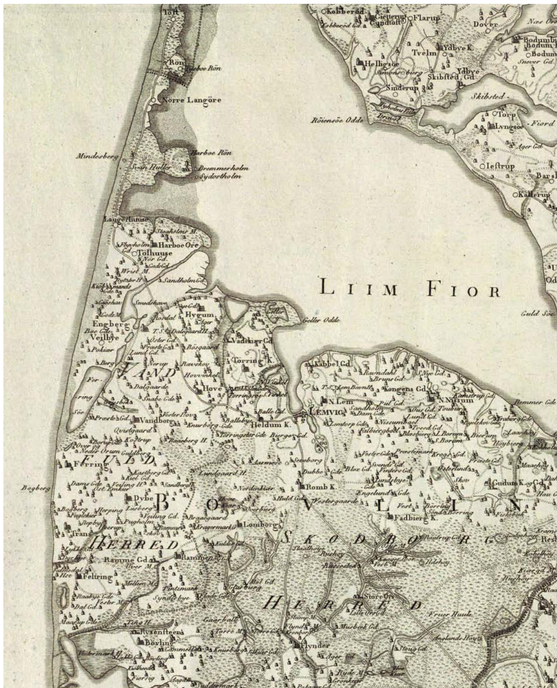
VANDFULD HERRED o. 1800. Herredet talte dengang 10 sognekirker: Harboøre, Engbjerg, Hygum, Hove, Vandborg, Ferring, Dybe, Ramme, Fjaltring og Trans. I Thyborøn opførtes 1908 en kirke, som indtil 1921 lå under Agger Sogn i Thisted Amt, herefter Harboøre Sogn, indtil Thyborøn 1954 blev et selvstændigt sogn. Udsnit af Videnskabernes Selskabs kort over Skivehus, Bøvling og Lundenæs amter 1800. 1:180.000. – Die Harde von Vandfuld um 1800. Die Harde zählte damals 10 Pfarrkirchen. 1908 wurde in Thyborøn eine Kirche errichtet, die bis 1921 zum Pfarrbezirk von Agger (Thisted Amt) gehörte; danach zu Harboøre bis 1954, als Thyborøn ein selbständiger Pfarrbezirk wurde.