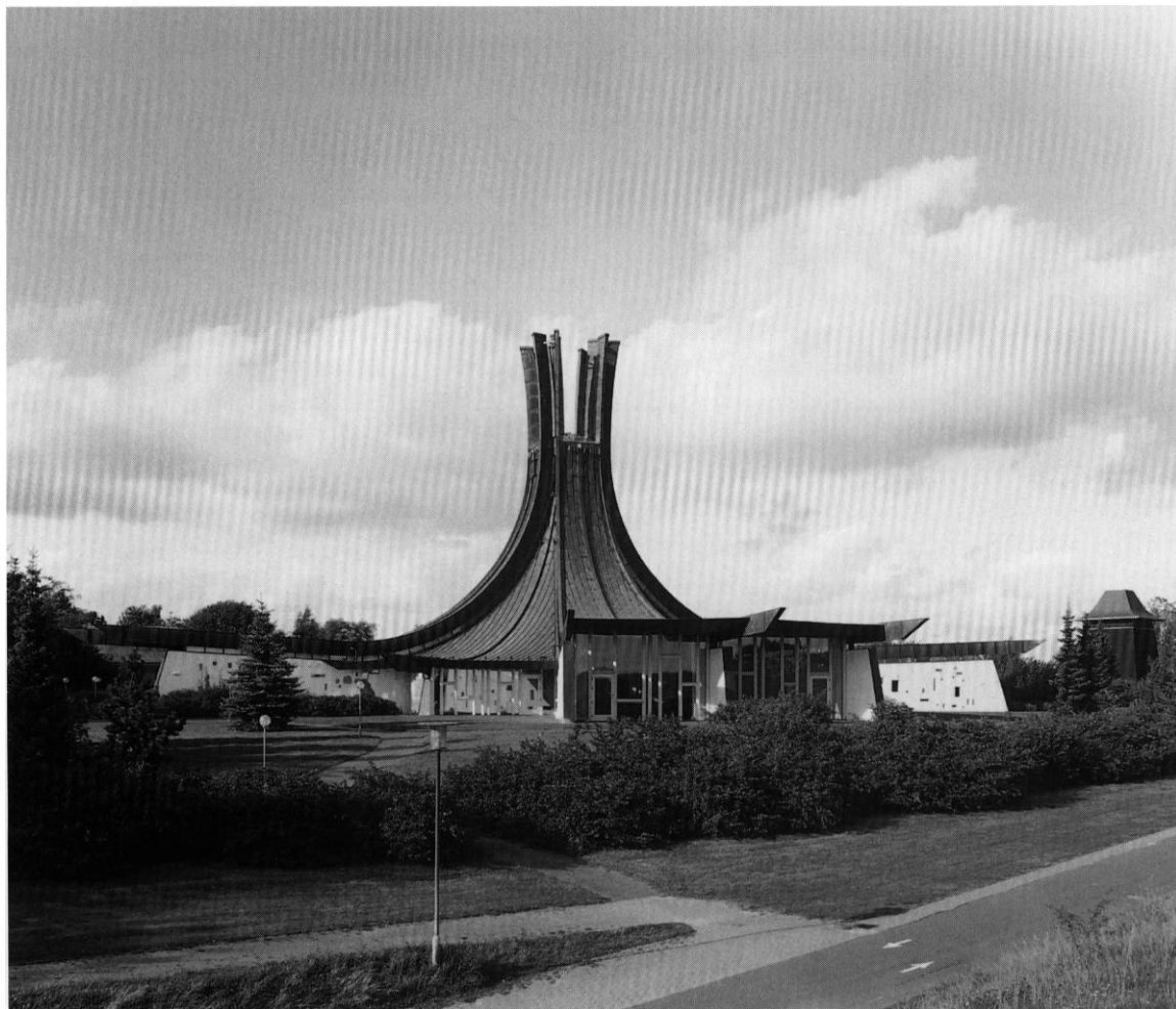
Fig. 1. Kirken set fra sydvest. HW fot. 1998. - Südwestansicht der Kirche.