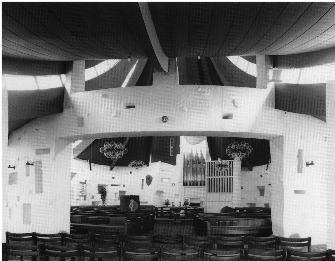
Fig. 3. Det centrale kirkerum set fra kirkesalen i vest. HW fot. 1998. - Der zentrale Kirchenraum vom westlichen Kirchensaal aus gesehen.

muret' arkade (et cirkeludsnit), indeholdende en lille, rundbuet dør.