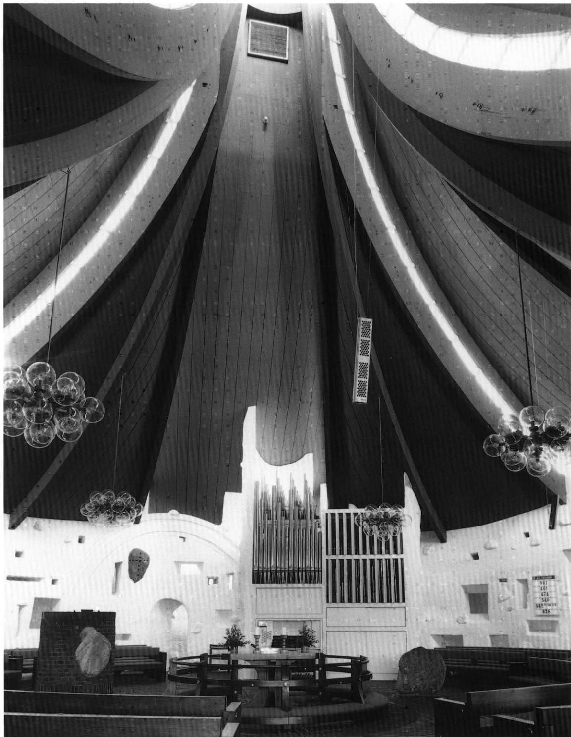
Fig. 4. Det centrale kirkerum set mod øst. HW fot. 1998. - Der zentrale Kirchenraum gegen Osten.