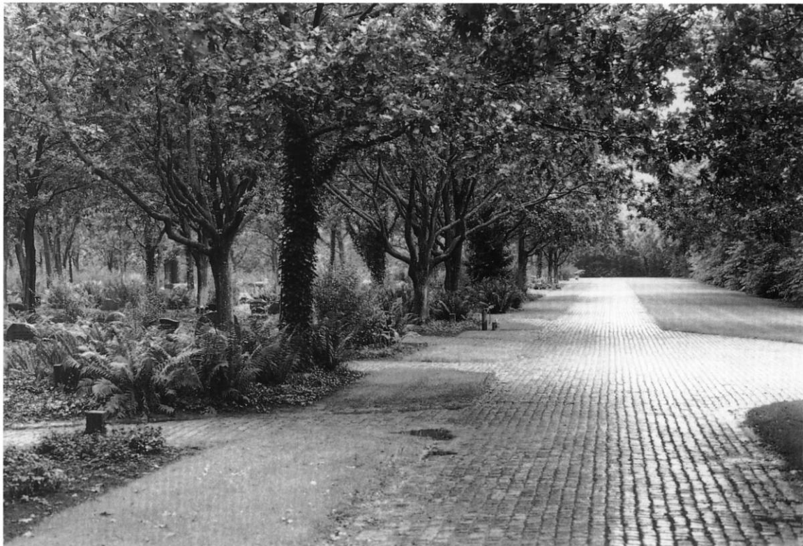
Fig. 2. Parti fra Nordre kirkegård, anlagt som skovkirkegård 1969 (s. 485). - Partie vom Nordfriedhof, angelegt als Waldfriedhof.