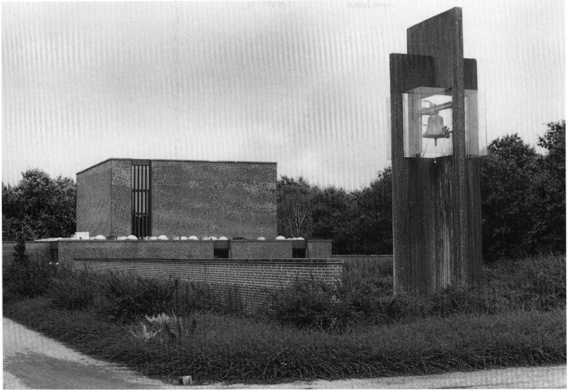
Fig. 4. Kapel på Nordre kirkegård, opført 1971, set fra nordvest (s. 486). - Leichenhalle auf dem Nordfriedhof, erbaut 1971, Nordwestansicht.

forekommer spredt over Nordjylland (Uldall, Kirkeklokker 132). Den er anskaffet til Herning \dagger kirke (s. 480), efter hvis nedrivning klokken har været brugt i den nuværende kirke (jfr. s. 441), indtil den 1956 kom hertil.