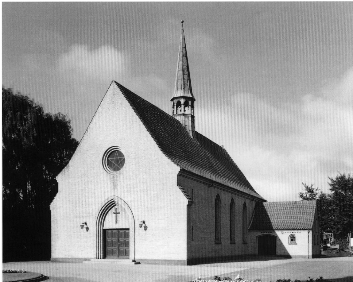
Fig. 1. Kapel på Vestre kirkegård, opført 1935, set fra nordøst (s. 483). HW fot. 1999. - Leichenhalle auf dem Westfriedhof, Nordostansicht.