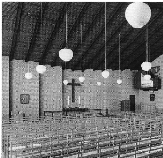
Fig. 2. Indre set mod nord. HW fot. 1998. - Kircheninneres gegen Norden.

duerne gentages sydsidens små korsformede åbninger, her som nicher. Indvendig dækkes rummet af en åben tagstol med træbeklædning. Gavlvæggene er pudsede, mens altervæggen mod nord står i gule blanke sten. Væggen er opdelt i syv afsnit, hvert svarende til to bjælke-