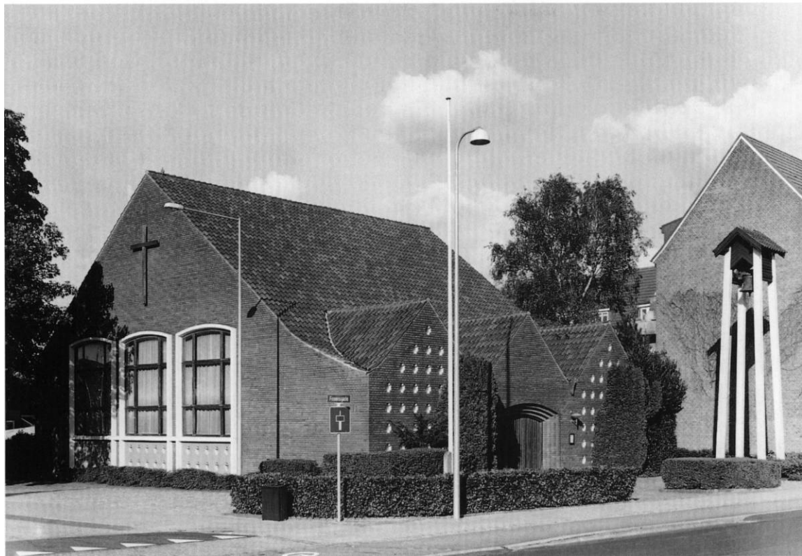
Fig. 1. Kirken set fra sydvest. HW fot. 1998. - Südwestansicht der Kirche.