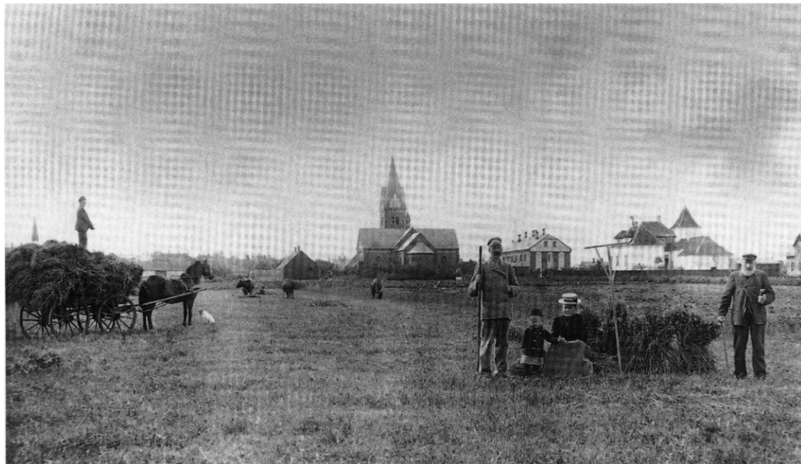
Fig. 1. Den nybyggede Herning kirke, set fra nord, kort tid efter dens indflytning til byen 1889 (s. 431). - Der Kirchenneubau Hernings von Norden kurz nach seinem Einzug in die Stadt 1889.