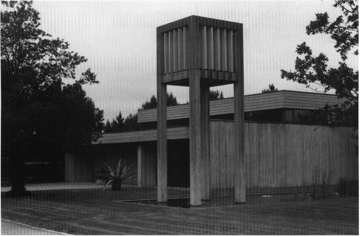
Fig. 1. Egekirkegården. Kapel og klokkestabel, 1976 (s. 330). NJP fot. 1998. - Egekirkegården (Eichenfriedhof). Leichenhalle und Glockenhaus, 1976.