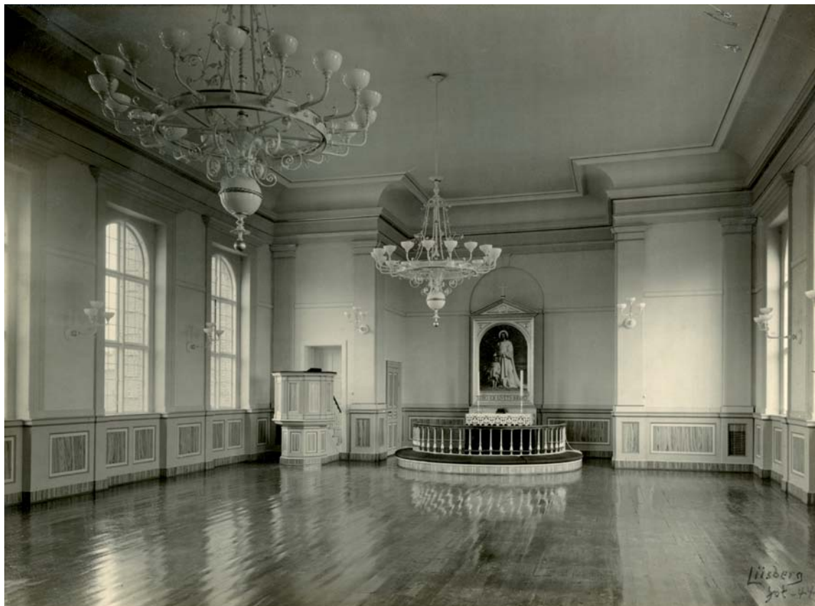
Fig. 2. Kirkesalens indre, 1944 (s. 2411). – Interior of the chapel, 1944.

veholdning, mens væggenes paneler samt dørene havde marmorerede fyldinger. I forbindelse med en istandsættelse i nyeste tid er dette farveskema erstattet af en farveholdning domineret af lyseblå og hvid.