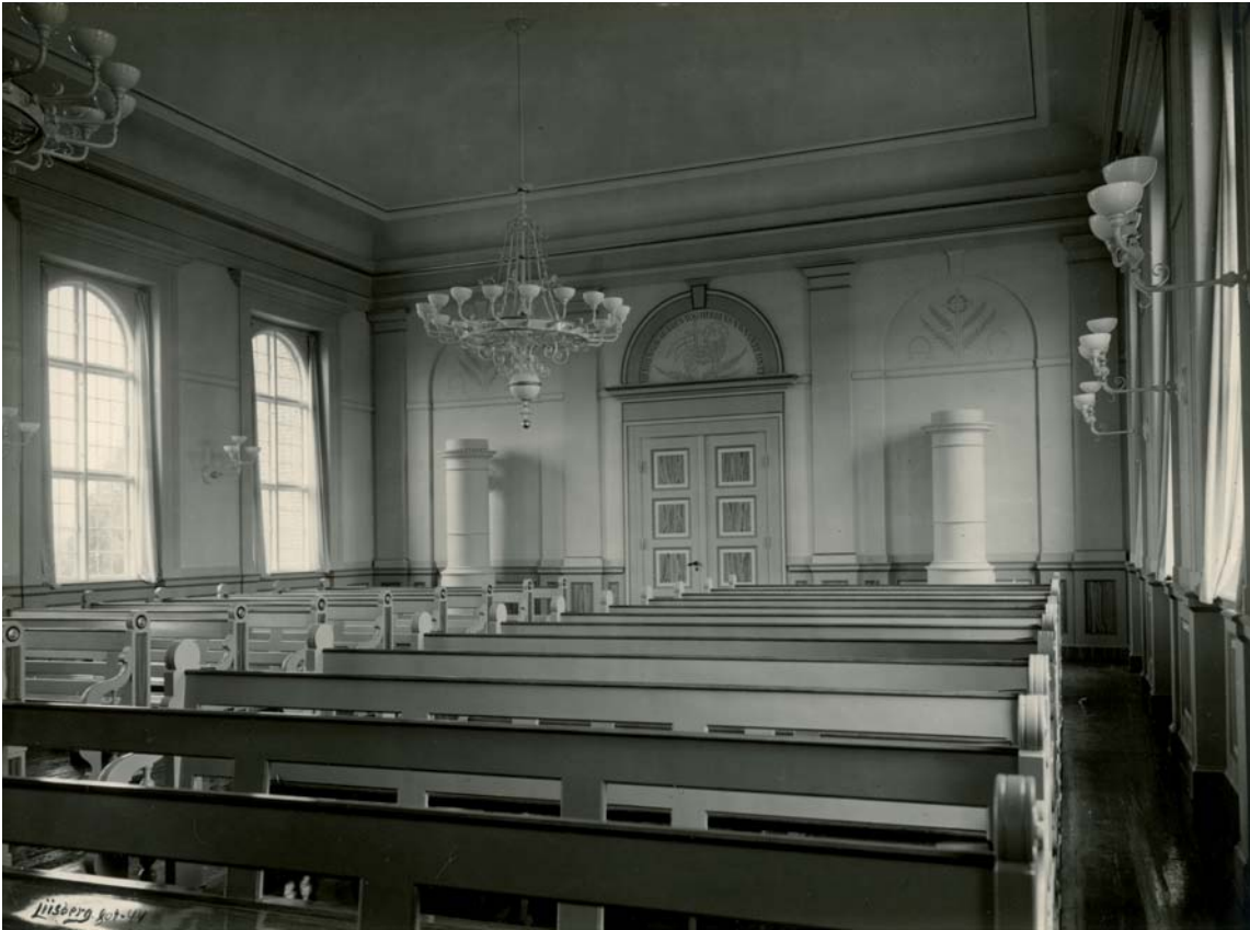
Fig. 3. Kirkesalens indre, 1944 (s. 2411). Foto Liisberg 1944, Middelfart Museum. – Interior of the chapel, 1944.

160×116 cm, er udført 1884 og signeret af Knud Hansen efter Carl Blochs altertavle til Holbæk Kirke fra 1873 ( DK Holbæk 2860). I Psykiatrisk Samling, Middelfart Museum (inv.nr. X 01632).