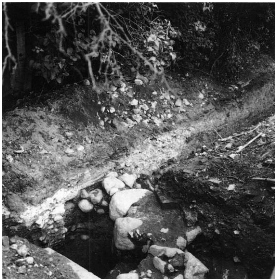
Fig. 4. Murfragment af sakristiets nordmur (s. 1879). Jørgen Nielsen, Møntergården fot. 1977. - Fragment of northern wall of the sacristy.

En pestforlængelse af skibet havde omtrent samme bredde som dette og var ved vesthjørnerne udstyret med to diagonaltstillede støttepiller. Det er usikkert, hvorvidt flankemurene flugtede med skibets, eller om tilbygningen eventuelt var en smule bredere, ligesom det er uvist, hvorvidt den var tænkt som underbyg-