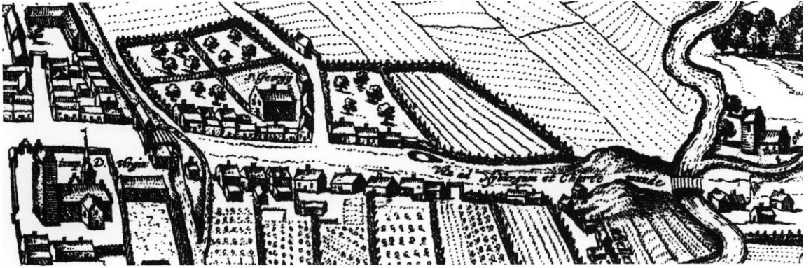
Fig. 1. Udsnit af Brauns og Hogenbergs kort over Odense 1593 med S. Jørgensgården (sml. s. 79 fig. 8). - Detail from Braun's and Hogenberg's Odense-map 1593 with St. Georg's Church (cf. p. 79 fig. 8).