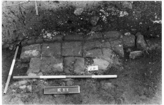
Fig. 5. Fragment af gulv i sydsiden af kirkens skib (s. 1880). - Fragment of the floor to the north in the nave of the church.

ning for et tårn. 35 Pillernes tilstedeværelse antyder en overhvelvning af bygningsdelen; i så fald med uprofilerede ribber, idet der ikke er fundet rester af profilribber i nedbrydningslagene. Vestpartiets aldersmæssige forhold til kirkens skib kunne ikke fastlægges med sikkerhed ved den arkæologiske undersøgelse, men da dens fundamentsgrøfter - i modsætning til skibets - gennemskar en række ældre grave, var den uden tvivl en yngre tilføjelse.