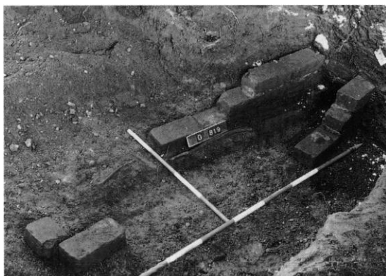
Fig. 6. Muret grav i kirkens skib (s. 1881). - Medieval brick-built cist in the nave of the church.

Muret grav (fig. 6), trapezformet, formentlig med separat hovedrum. Opmuret af tre skifter munkesten, lagt i mørtel og uden spor af låg eller anden overdækning. Af kisten var bevaret godt halvdelen, regnet fra fodenden, samt halv-