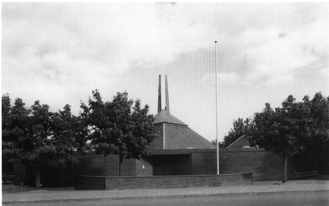
Fig. 1. Kirken set fra vest. Henrik Wichmann fot. 1997. - The church seen from the west.