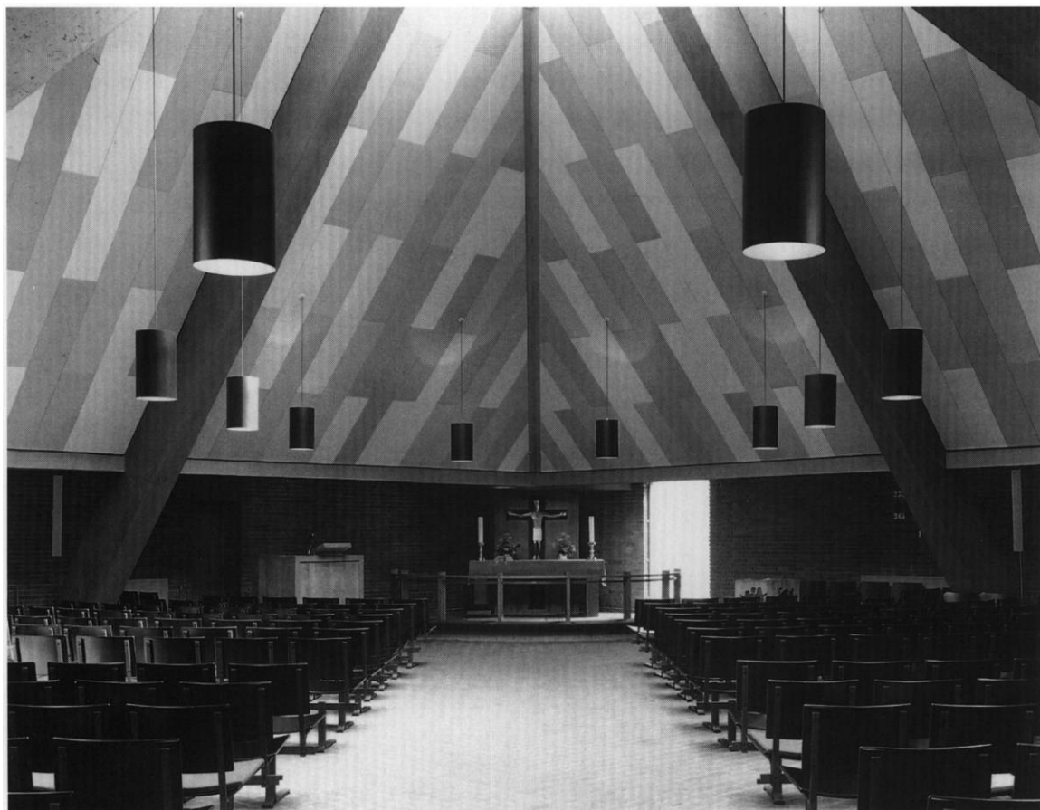
Fig. 3. Indre set mod øst. Henrik Wichmann fot. 1997. - Interior to the east.

Komplekset er opført 1959-61 efter tegninger af Erik og Ebbe Lehn Petersen. Grundplanen udgøres af et kvadrat med afskårne hjørner (fig. 2), hvorover er rejst to pyramideformede tagkonstruktioner. Underbygningen er opført af røde mursten, mens pyramidetagene er beklædt med skifer. Over det østre hjørne rejser sig to 20 m høje, kobberklædte spir, mellem hvilke klokken hænger. Det markante sternbræt mellem mur og tag var oprindeligt beklædt med eternitplader, der 1967 erstattedes af kobber. 7