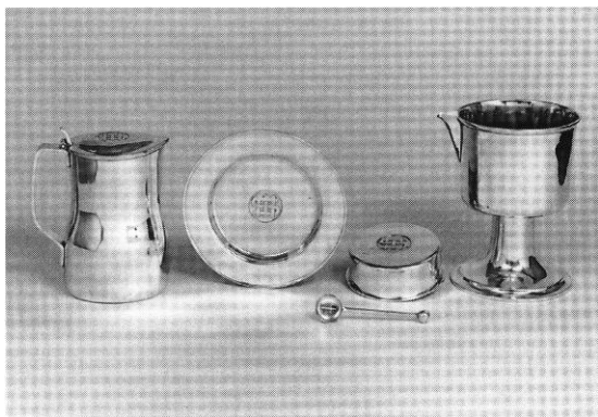
Fig. 5. Altersølv. Fremstillet 1961 af R. F. Bratland efter tegninger af Kaare Klint og Mogens Koch. Henrik Wichmann fot. 1997. - Altar plate, made in 1961 by R. F. Bratland after drawings by Kaare Klint and Mogens Koch.

De oprindelige, løse l'stole var opstillet i kvartcirkel om alteret. Efter lange overvejelser erstattedes de 1995 af afaste bænke . 18