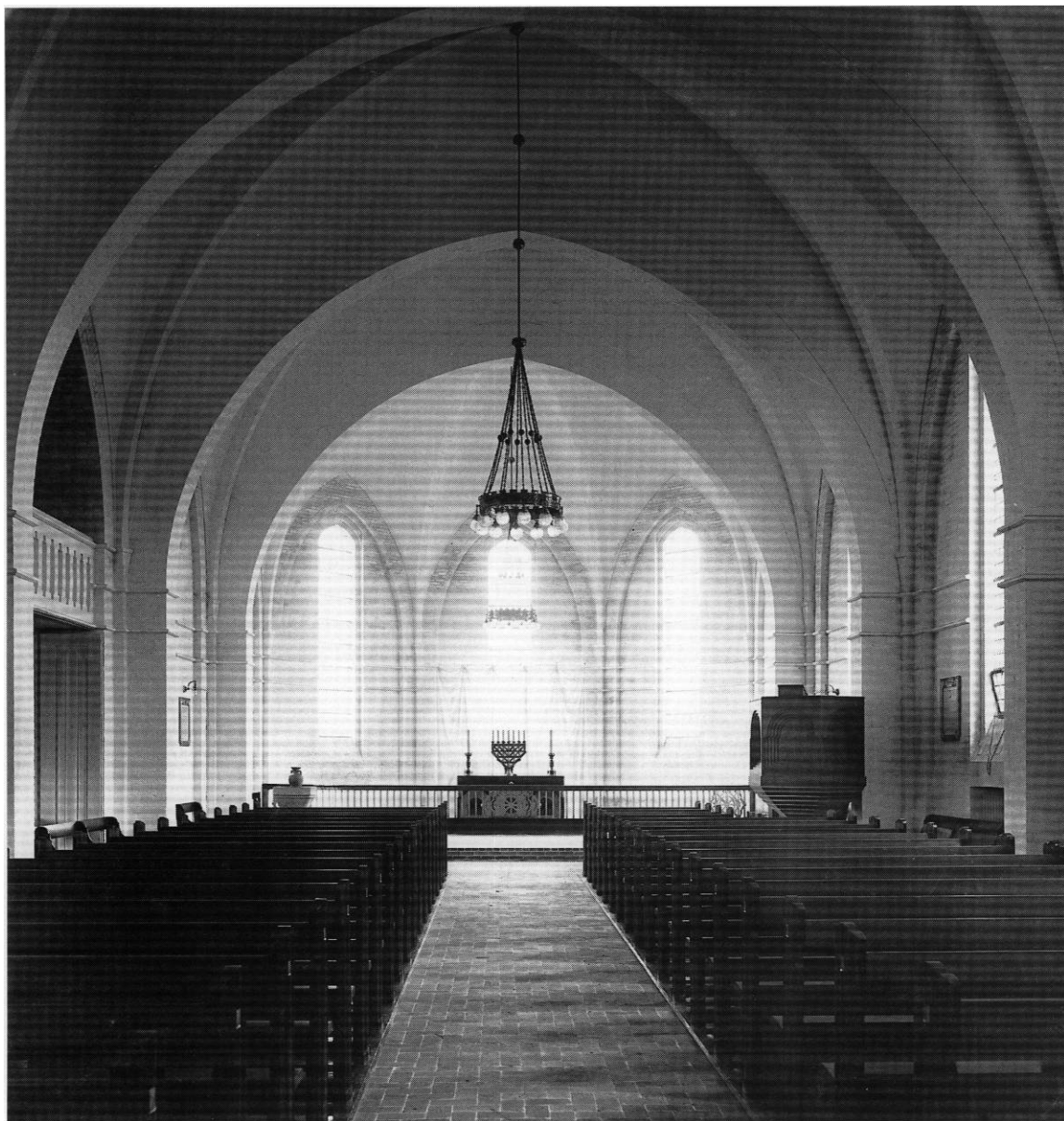
Fig. 7. Indre set mod vest, o. 1920. - Interior to the west, c. 1920.

kens 75-års jubilæum af Anne Marie Egemose i farverne grøn og violet. 7 7) Af violet silke med gaffelkors og blomstermønster.