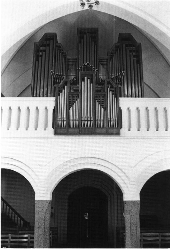
Fig. 9. Orgel, 1958, tegnet af Esben Klint (s. 1628). Annelise Olesen fot. 1975. - Organ, 1958, designed by Esben Klint.