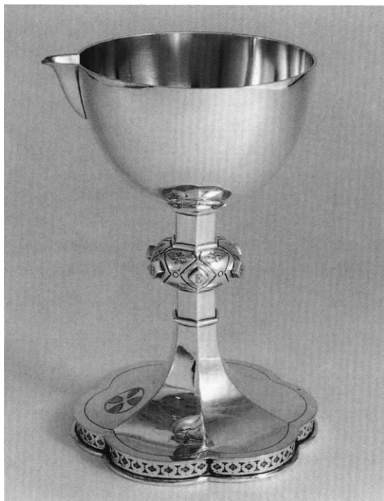
Fig. 5-6. Alterkalk nr. 1 og 2. 5. Alterkalk nr. 1, udført 1919 af F. Kastor Hansen efter tegning af P. V. Jensen-Klint. 6. Alterkalk nr. 2, udført 1920 af ukendt guldsmed som del af et Margrethesæt. - 5-6. Chalice nos. 1 and 2. 5. Chalice no. 1 made by F. Kastor Hansen in 1919 after the design by P. V. Jensen-Klint. 6. Chalice no. 2 , made in 1920 by unknown silversmith as part of a so-called Margrethe set.