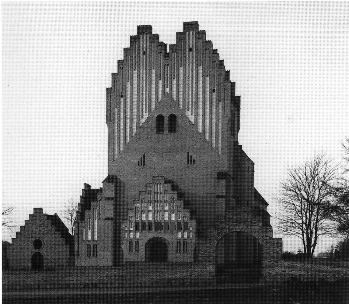
Fig. 3. Kirken set fra sydøst o. 1920. - The church seen from the south-east, c. 1920.

Kirken er rejst på en bakkeskråning, og bygningskroppen dominerer på en strækning den let slyngede Skibhusvej, ligesom den markante, tvedelte tårnfacade udgør et point de vue for vestgående færdsel på den tilstødende Døckerslundsvej. Kirkebygningen ligger nogenlunde midt i et grønt anlæg, omgivet af mure, som i vest danner skel til den egentlige kirkegård, der er beskrevet i forbindelse med byens øvrige kirkegårde. Præstegården nord for kirken blev indrettet i den tidligere hovedbygning til gården Gammel Annasholm, der 1983 erstattedes af en ny bygning, mens området syd for kirken 1981 var blevet udfyldt af et sognehus. Langs Skib-