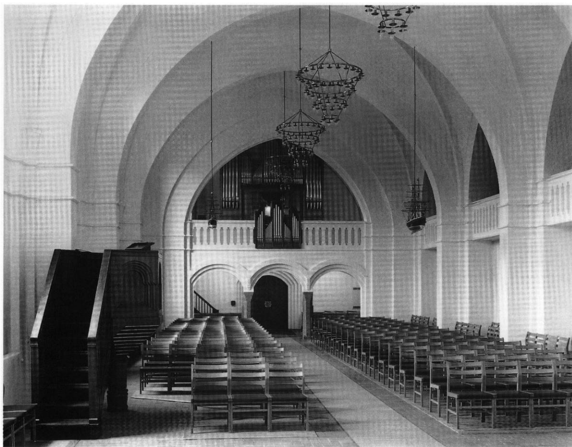
Fig. 8. Indre set mod øst. Henrik Wichmann fot. 1998. - Interior to the east.

Klokker . Af kirkens i alt fire klokker leverede De Smithske Jernstøberier 1919 de tre, som efter arkitektens forslag bærer indskrifterne: »I den treenige Guds Navn«, »kalde vore trede Tunger«, »til Arbejd og Hvile Helgen Fred«. 34 1) 93,4 cm i tv., stemt i H. Skænket af direktør Chr. Ørnberg. 33 2) 78,5 cm i tv., stemt i D. Købt for indsamlede midler. 33 3) 59,1 cm i tv., stemt i G. Denne klokke bærer desuden indskriften »Til minde om Th. Steenbuch, Sognepræst ved Sct. Hans Kirke«. Skænket af Wilhelm Brandt. 33 4) 1932. 122 cm i tv., stemt i E. Med indskriften »Odense Fredens Sogn. Fred være med Eder. Støbt af B. Løw og Søn, København. 1-4-1932«. Købt for indsamlede midler, datoen henviser til landsognets indlemmelse i Odense Kommune. 33