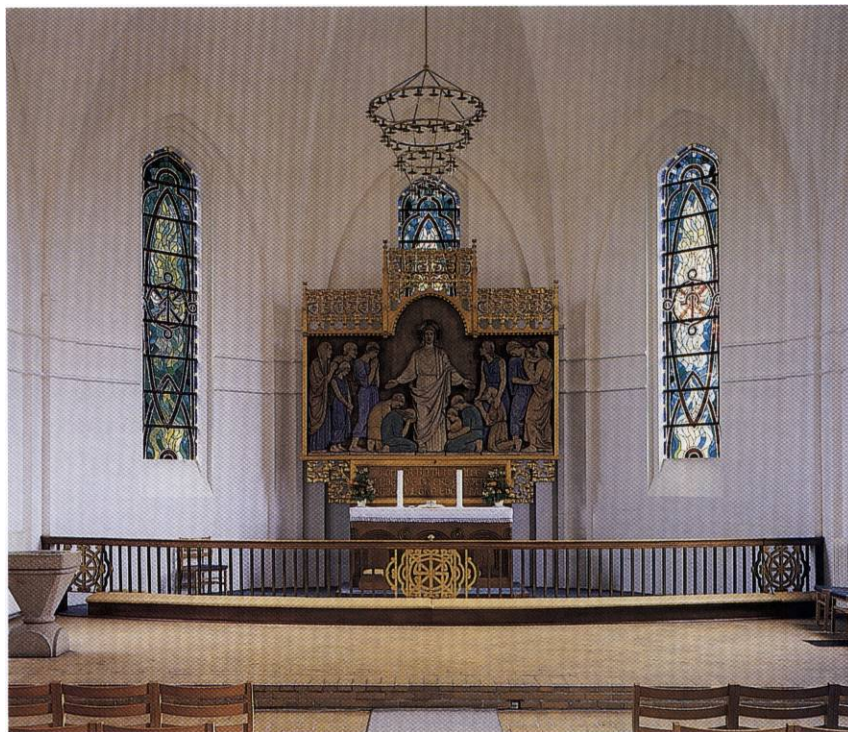
Fig. 4. Koret set mod vest. Henrik Wichmann fot. 1998. - Interior to the west.

rende baldakin med dekoration af stærkt fligede, tredelte blade. Predellaen består af en indskriftstavle, ligeledes flankeret af blade. Indskriften »Kommer hid til mig« (Matt. 11,28) refererer til storfeltets relief, der viser Kristus stående i midten med udbredte hænder, mens de lidende og besværede strømmer til, nogle stående, andre knælende for hans fødder. Relieffet er stafferet i gule, grønne, blå og hvide farver på en ubehandlet baggrund, mens rammeværket er forgyldt. 1969 konstateredes, at farverne var slidte, afblegede og til dels dekomponerede. 18