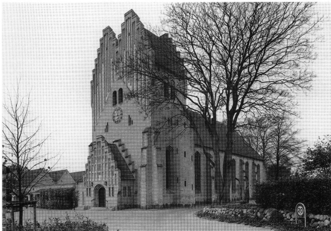
Fig. 1. Kirken set fra øst. - The church seen from the east.