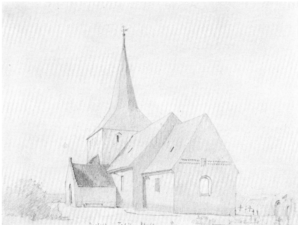
Fig. 3. Systofte. Ydre, set fra sydøst for ombygningen. Efter skitse af Hans I. Holm 1869.

solur. I det indre har kampestenssylden stukket frem, den blev 1844 krævet fjernet eller dækket med en bæk (syn). 1692—93 fik våbenhuset nyt bjælkeloft og tagværk (rgsk.).