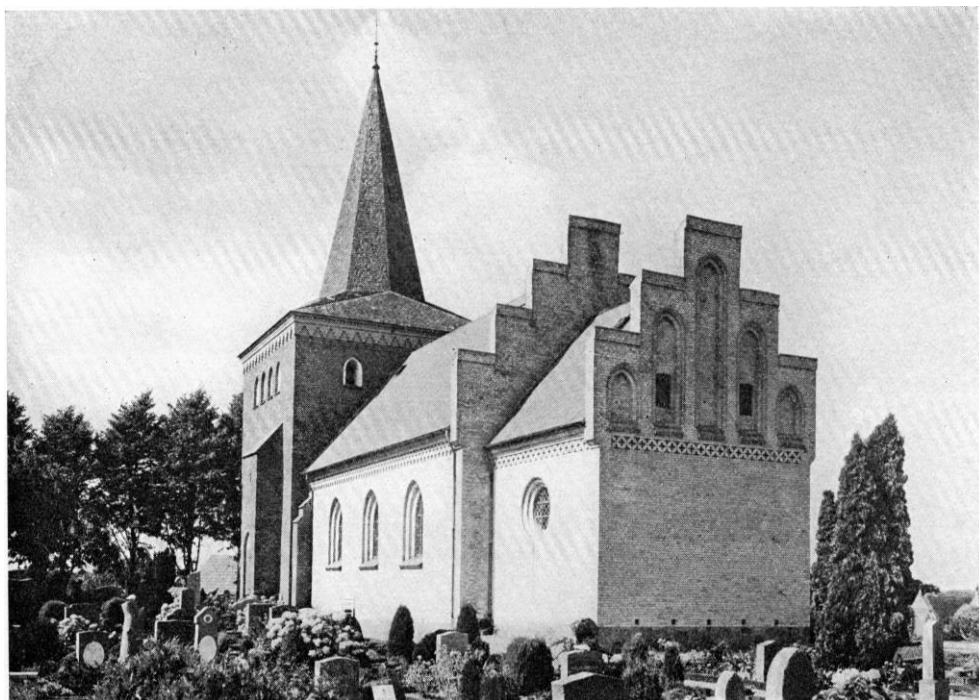
Fig. 1. Systofte. Ydre, set fra sydøst.