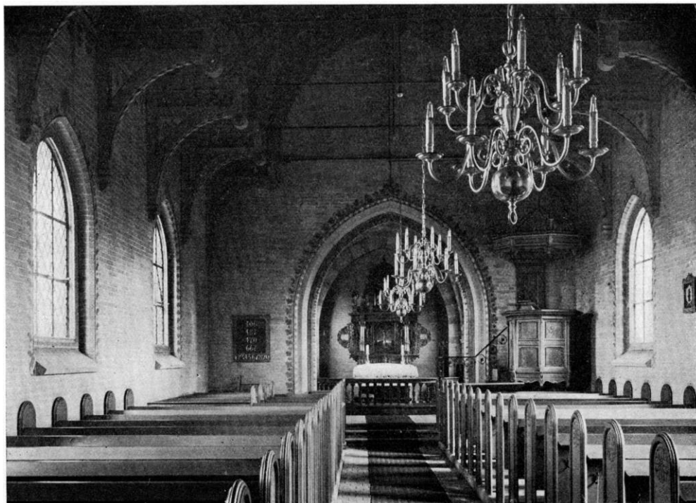
Fig. 4. Systofte. Indre, set mod øst.