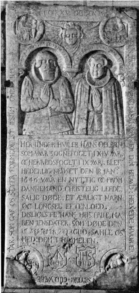
O. N. 1942